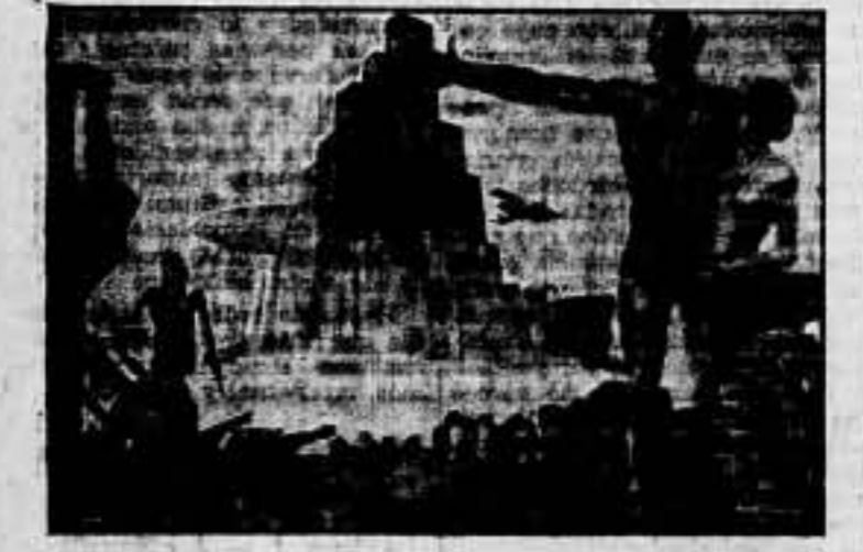
Tirada limitada 52 por 65 - Precio: 1'00 pta. - 25 por 100 descuento

LA BESTIA HUMANA por EMILIO ZOLA 500 páginas, 5 pesetas MEMORIAS por MAGNO 72 páginas, 0'65 cta.