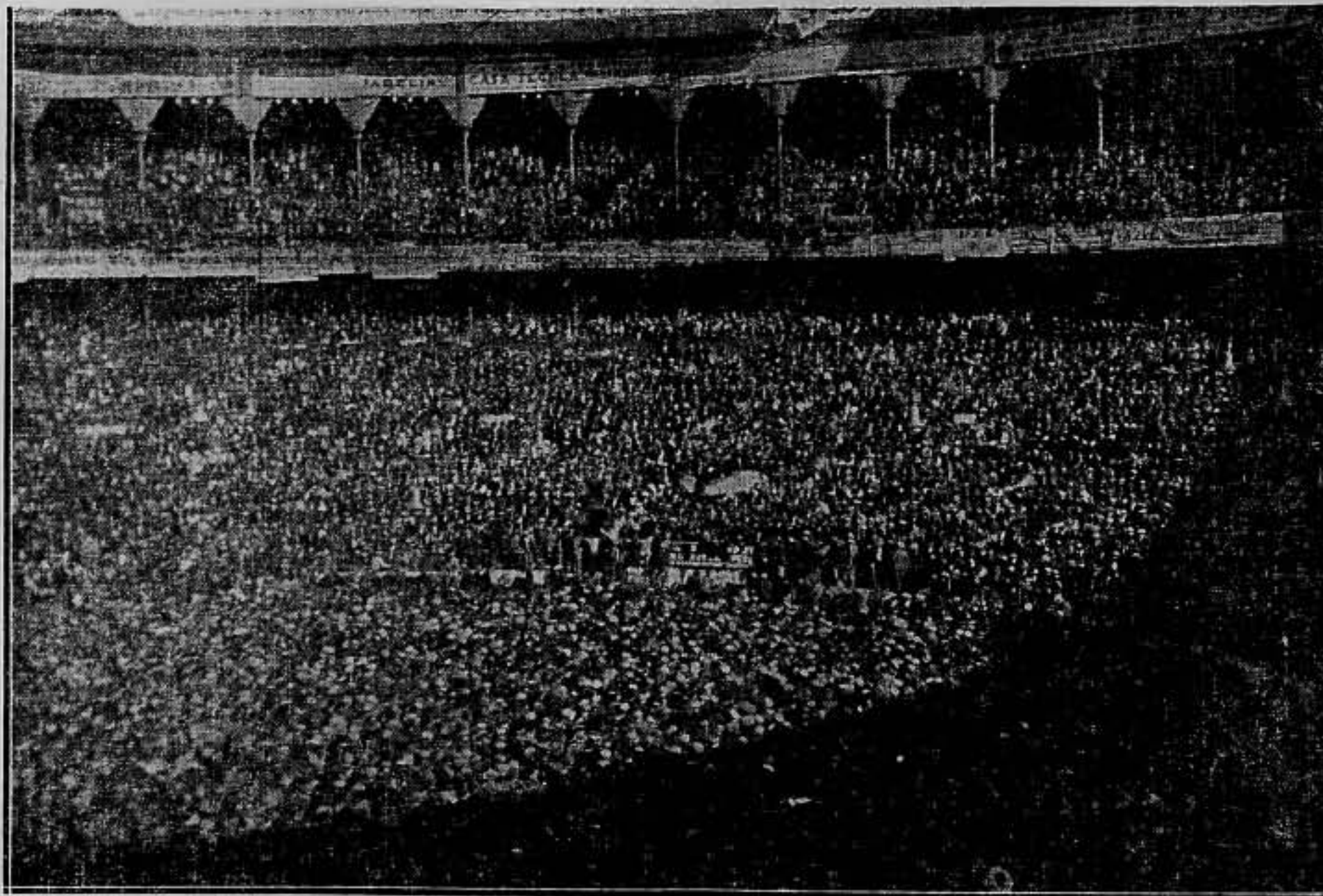
UNA VISTA PARCIAL DE LA PLAZA DE TOROS MONUMENTAL DURANTE EL DESARROLLO DEL ACTO DEL DOMINGO

como lo hacen nuestros enemigos, el momento de la acción. Nos veremos obligados a intervenir en los acontecimientos, para que éstos no nos arrastren y para que nuestra intervención modifique el curso de las cosas. Tenemos, por lo tanto, que adaptar nuestras tácticas a las circunstancias, porque lo que queremos es una victoria decisiva sobre los enemigos de la libertad y del bienestar para todos.