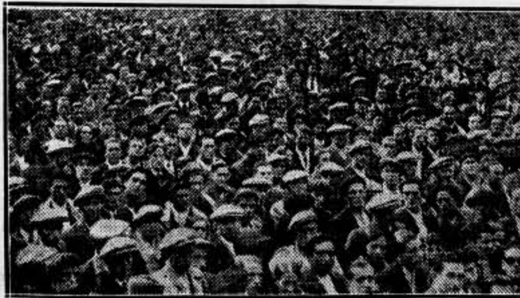
(Véase la información en segunda página.)