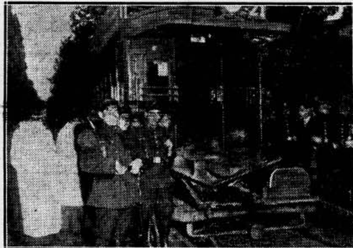
Cómo quedó un tranvía, manejado por los "expertos" oficiales de la Marina, después de un choque, en el Paseo de Gracia.