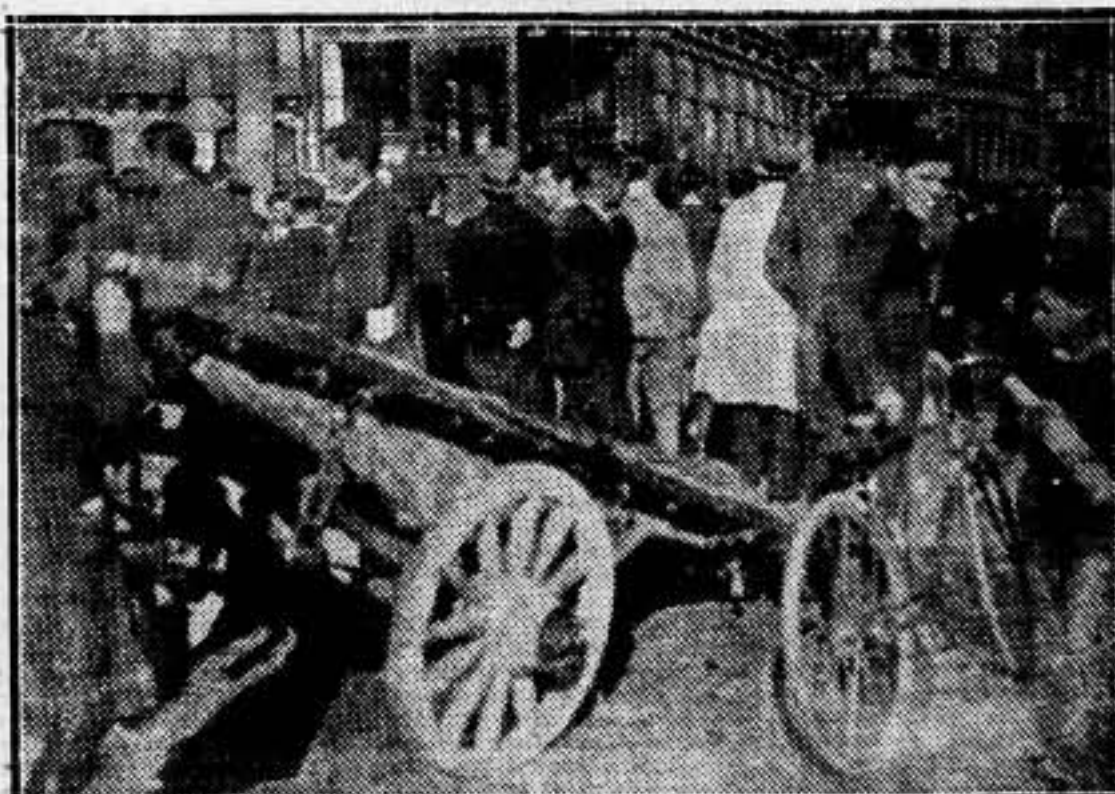
El carro que se ve en esta "foto" quedó partido por gala en dos a consecuencia de un choque con un tranvía; el caballo que lo conducía quedó herido y el carretero se salvó por casualidad