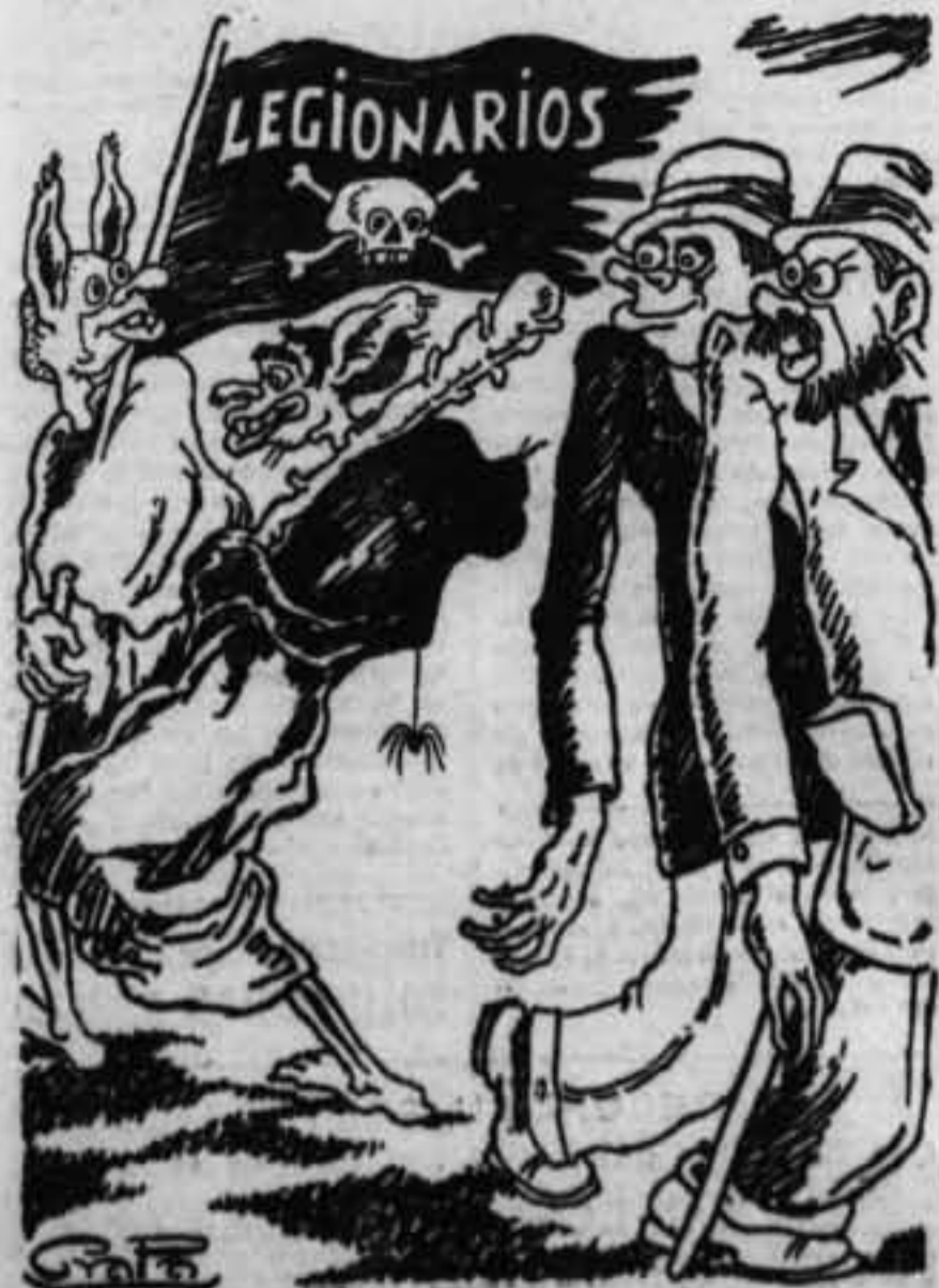
¿De dónde ha sacado estos microbios? De algún cuerpo descompuesto.