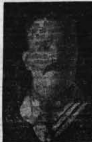
EL DICTADOR DE CHILE, GENERAL IBÁÑEZ