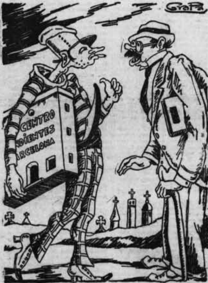
...por qué en vez de tomar al Centro de Dependientes no optabas por algún convento? -Le diré a usted. En los conventos viven mis padrinos.