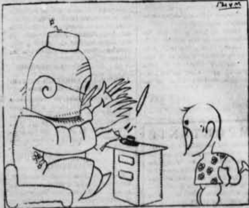
—¡Periquito! O callas o...