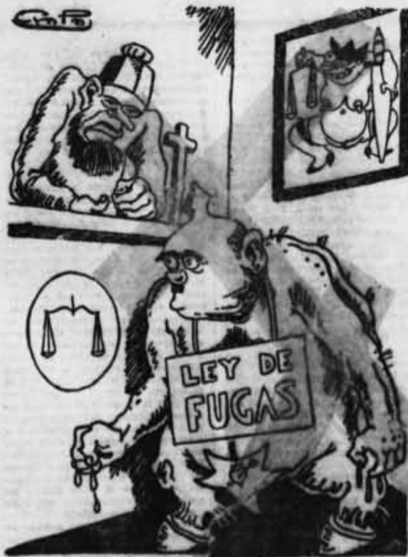
—No puede juzgarte, El Código penal vigente. Pero sí queda una solución. —¡Osh! —Muestré de vergüenza...