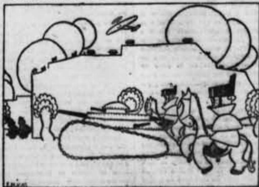
... IX que sus protestas por la de Madrid...