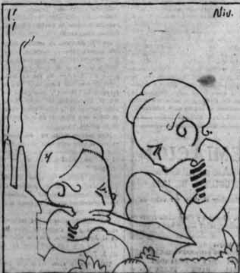
—¿Cómo te sienta cuando vas a dar la analítica vespertina? —Y te sienta cuando vas a liberar a los presos gubernativos? —¿Hasta dónde el medio sabe quién los mandó detener?