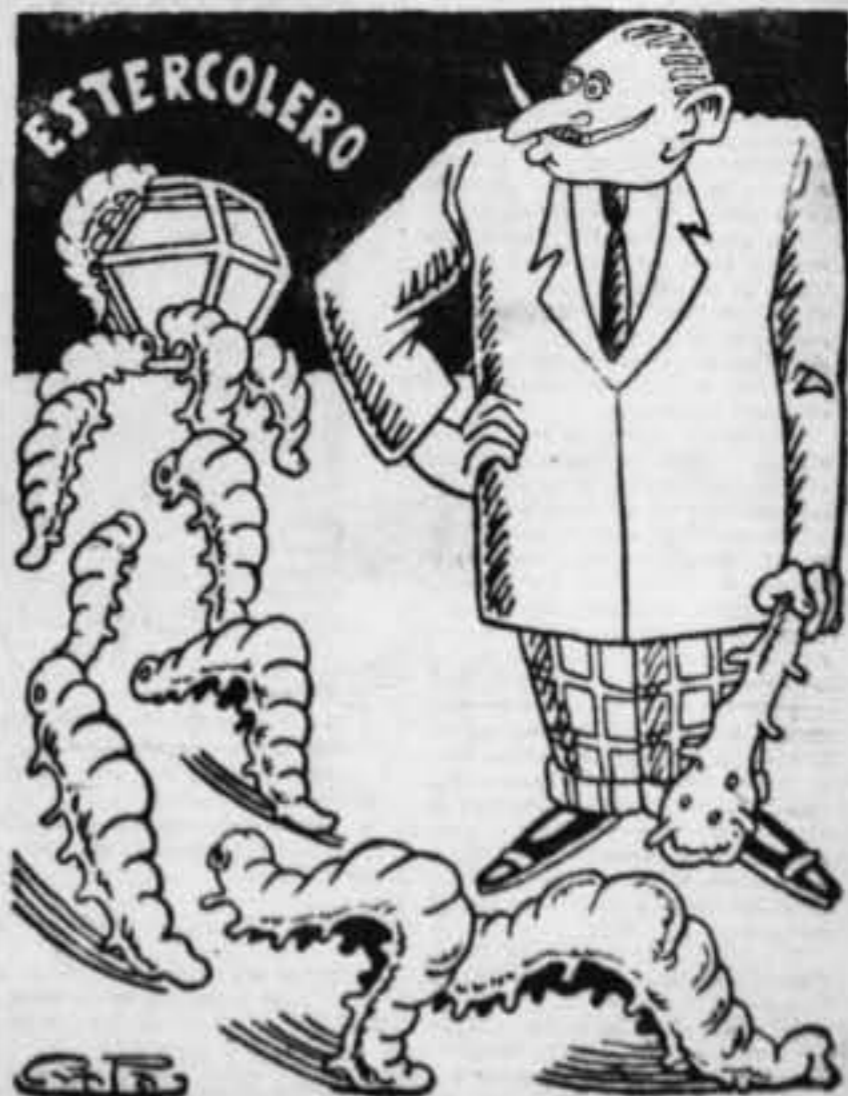
De frente..... ¡Marchen.