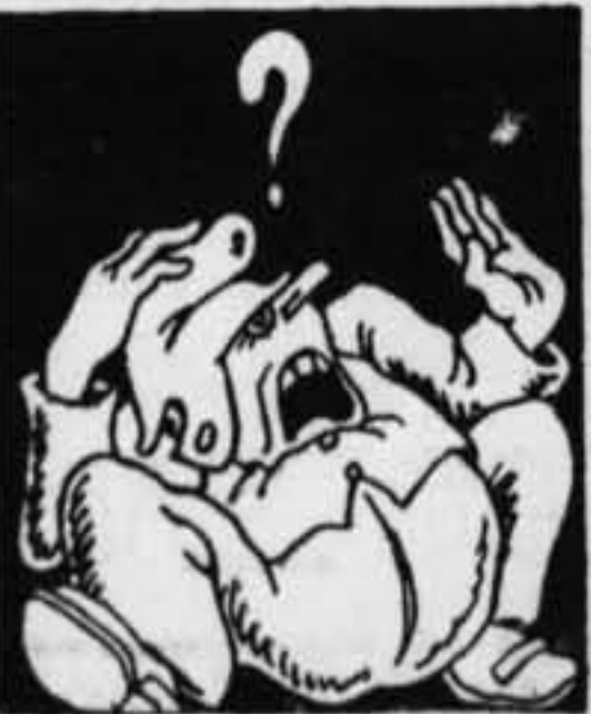
— Y ahora... ¡Quiero ya a volar mi clientela republicana, fallada a la palabra que le prometí!