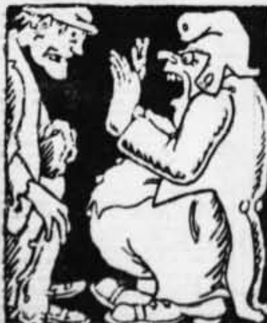
Como se allana el terreno. — ¡Vale demasiado lejón!... Con el pueblo no se puede revolucionar nada.