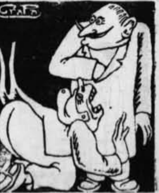
— Por Dios!... Haga usted una pequeña revolución!... — Sería complacido, Metase en la cárcel a los hombres de la C. N. T.