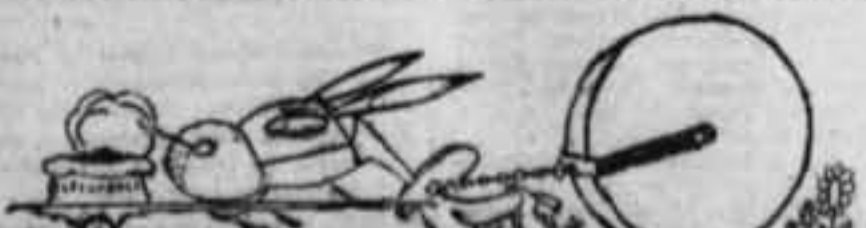
COMO SE ALLANA EL TERRENO

El «Giornale d'Italia» termina alacando duramente a quienes en su miseria espiritual no saben evaluar el gesto heroico de 48 aviadores, que al mando del propio ministro del Aire, se disponen a volar de Europa al Brasil, atravesando el Atlántico en escuadrilla, como no lo efectuó jamás la aviación de ningún país. — Atlanta.