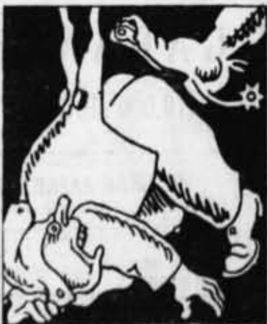
— Yo cuento con un amigo que tiene muy buena pata para estos quehaceres.