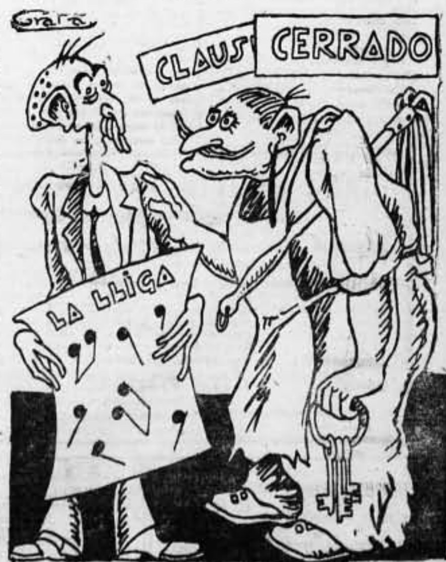
—Suelta, suelta tus notas. En la galería ya no hay público para el abucheo.