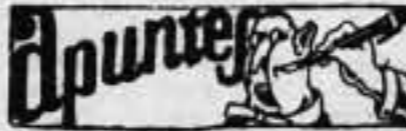
MIRANDO AL MAÑANA

Los Comités de la Confederación Nacional y la Confederación Regional del Trabajo de Cataluña, advierten a todos los trabajadores que no se dejen sorprender por unas hojas que han circulado por ahí, carentes en absoluto de solvencia en la organización obrera, anunciando una huelga para el día 25 del corriente. Es absolutamente falso y nadie debe dejarse sorprender por los oportunistas sin responsabilidad en la C. N. T.