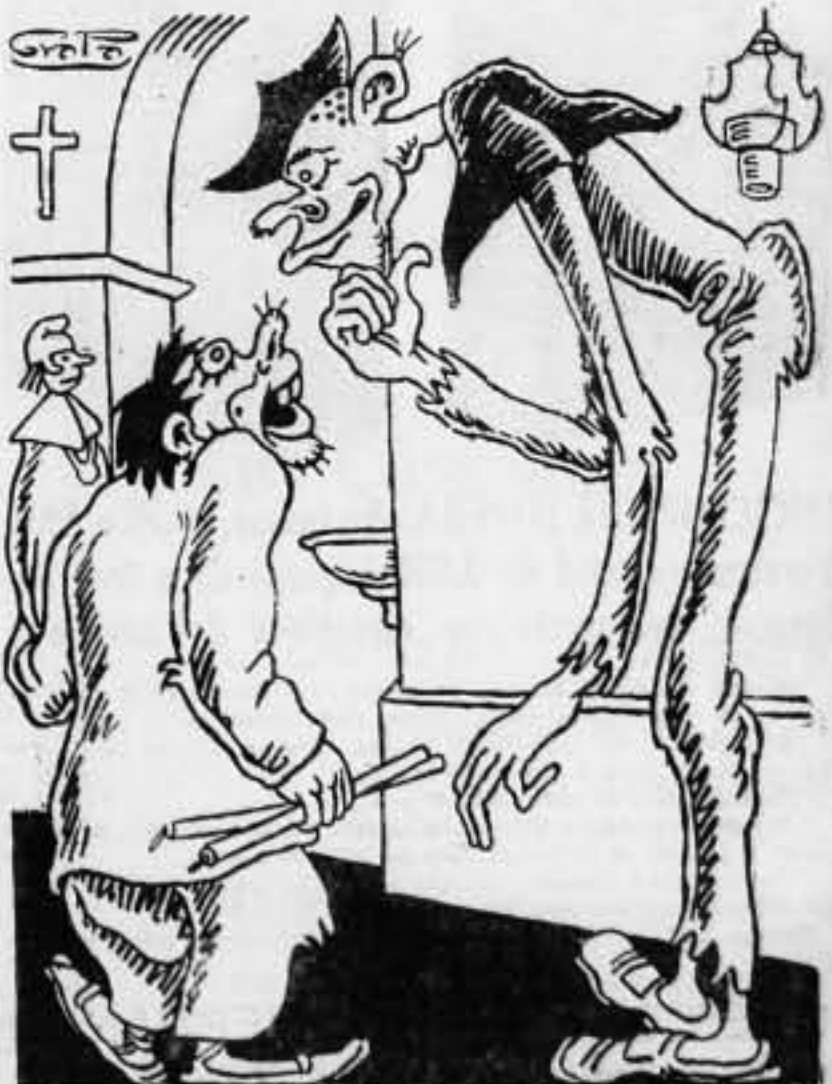
—¿Quién te ha mandado poner gorro frigio San Galimatias! —¡Pero, monseñor! ¡Cómo van a creer que es usted republicano, si nos quitamos las coronas de los santos!