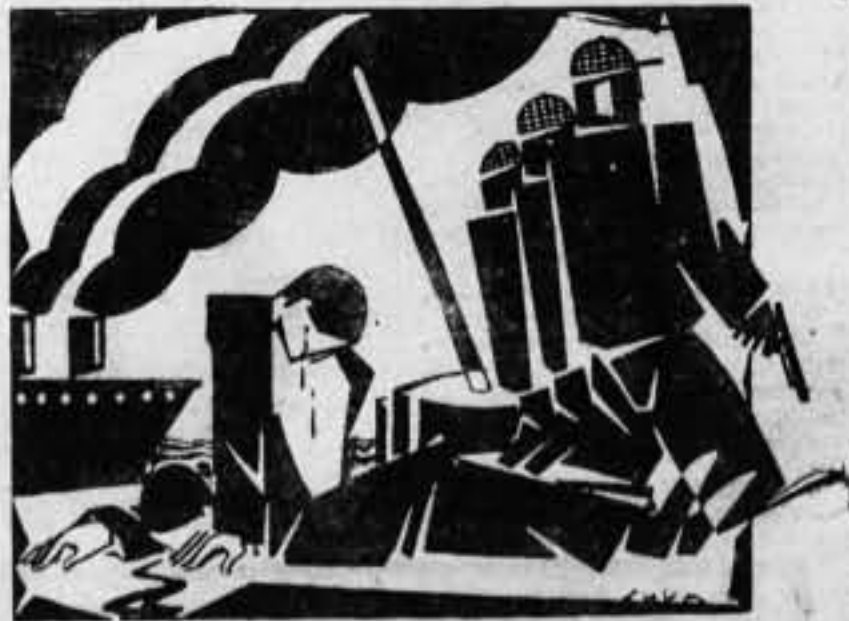
La Unión General de Trabajadores ha sabido aprovechar la rebaja de salarios de los aculinos...