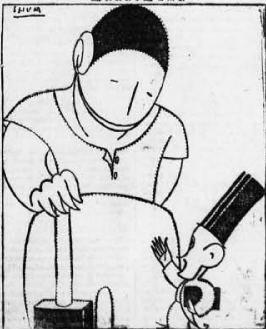
U. U. — La que yo represento al obrero, C. N. T.— Si a los del Sindicato Libre.

SOLIDARIDAD OBRERA, Barcelona, no.—«Valencia, 11.—Sindicato del Ramo de la Madera, de Valencia, protesta, indignado, por asesinato de camaradas por nuestros hermanos anarcistas. Reclamamos máxima seriedad en vuestras determinaciones.»