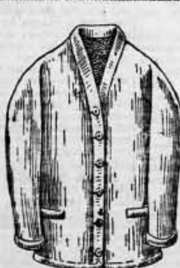
SUETER de lana punto inglés, para caballero, propios para sport, a 5 pesetas