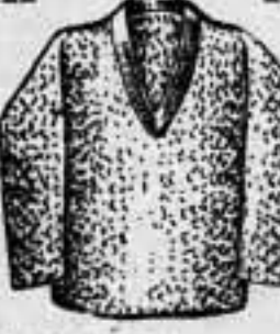
PULLOVERS lana, para niño, colores y dibujos, varias tallas: 1 y 2 a 3 pesetas 3 y 4 a 4 pesetas 5, 6 y 7 a 5 pesetas