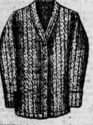
SUETERS de lana para señora o ca-ballero, gran surtido en colores y dibujos, a 3'75 pesetas