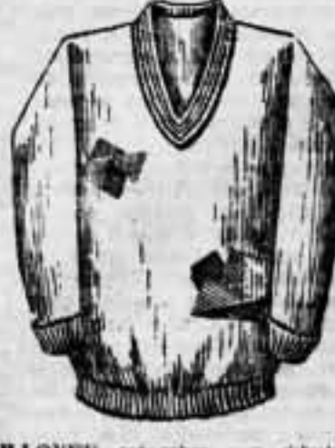
PULLOVER estambre con dibujos y colores de gran fantasía. MODA, a 12'50 pesetas