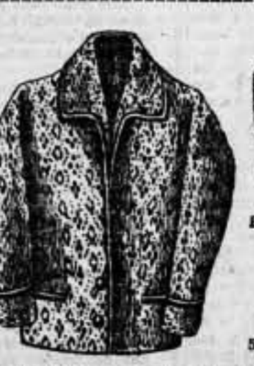
CHAQUETA de lana y seda, para señora, colores y dibujos fanta-sía, a 8 pesetas