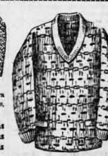
PULLOVER de lana, para caballero, dibujos novedad, propios para ves-tir, a 7 pesetas