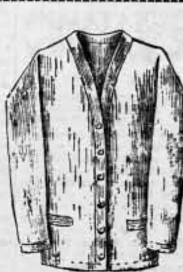
SUETER de lana Pirineos, para se-ñora, colores lisos de novedad, a 10 pesetas