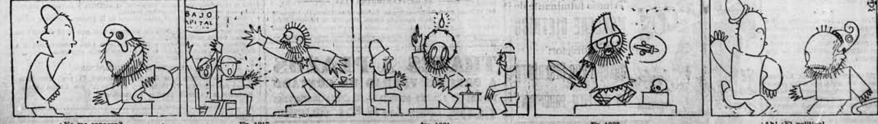
¿No me conoces?