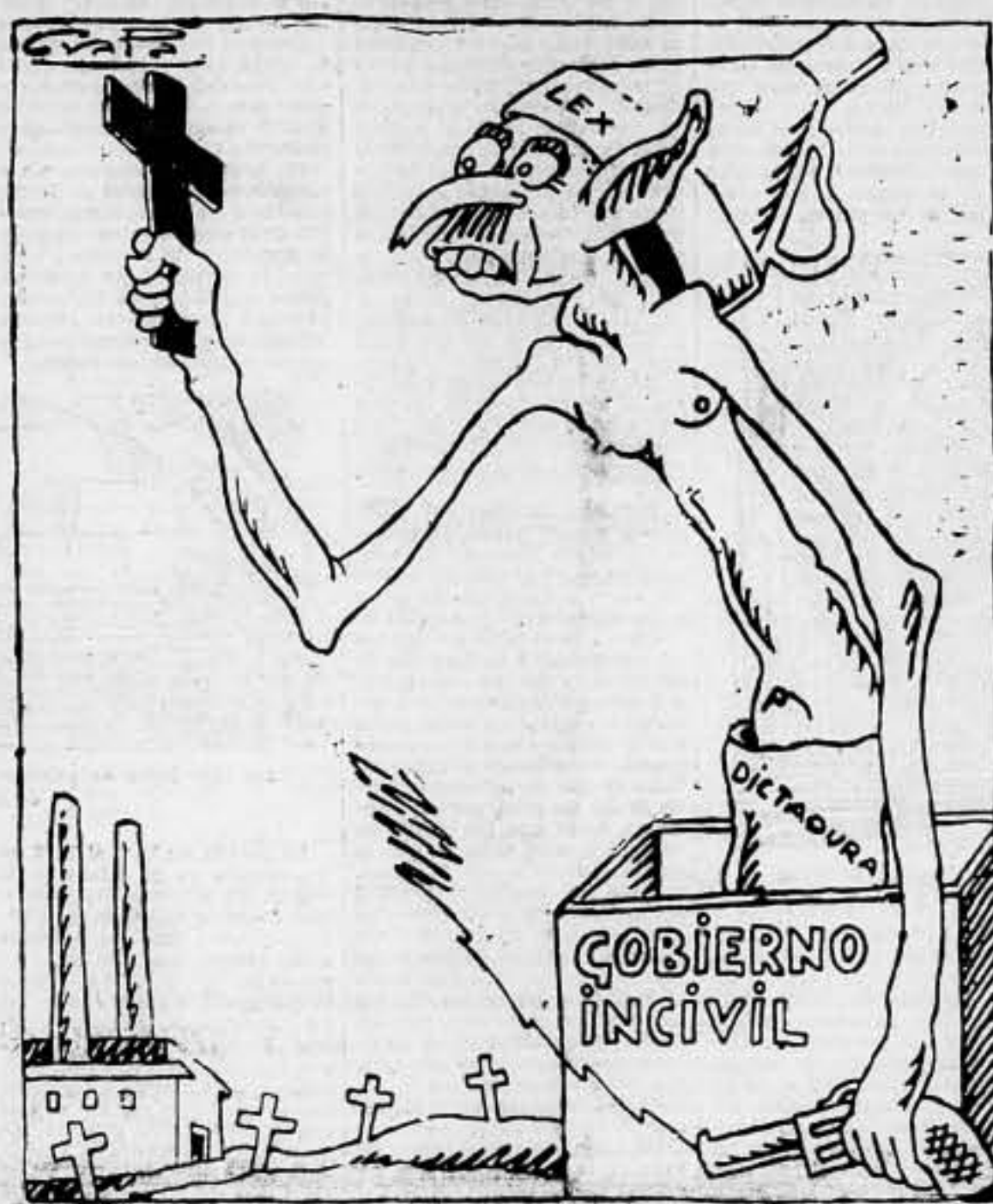
Nuestros crímenes de cada día, toléralos, Pueblo, el día de hoy..