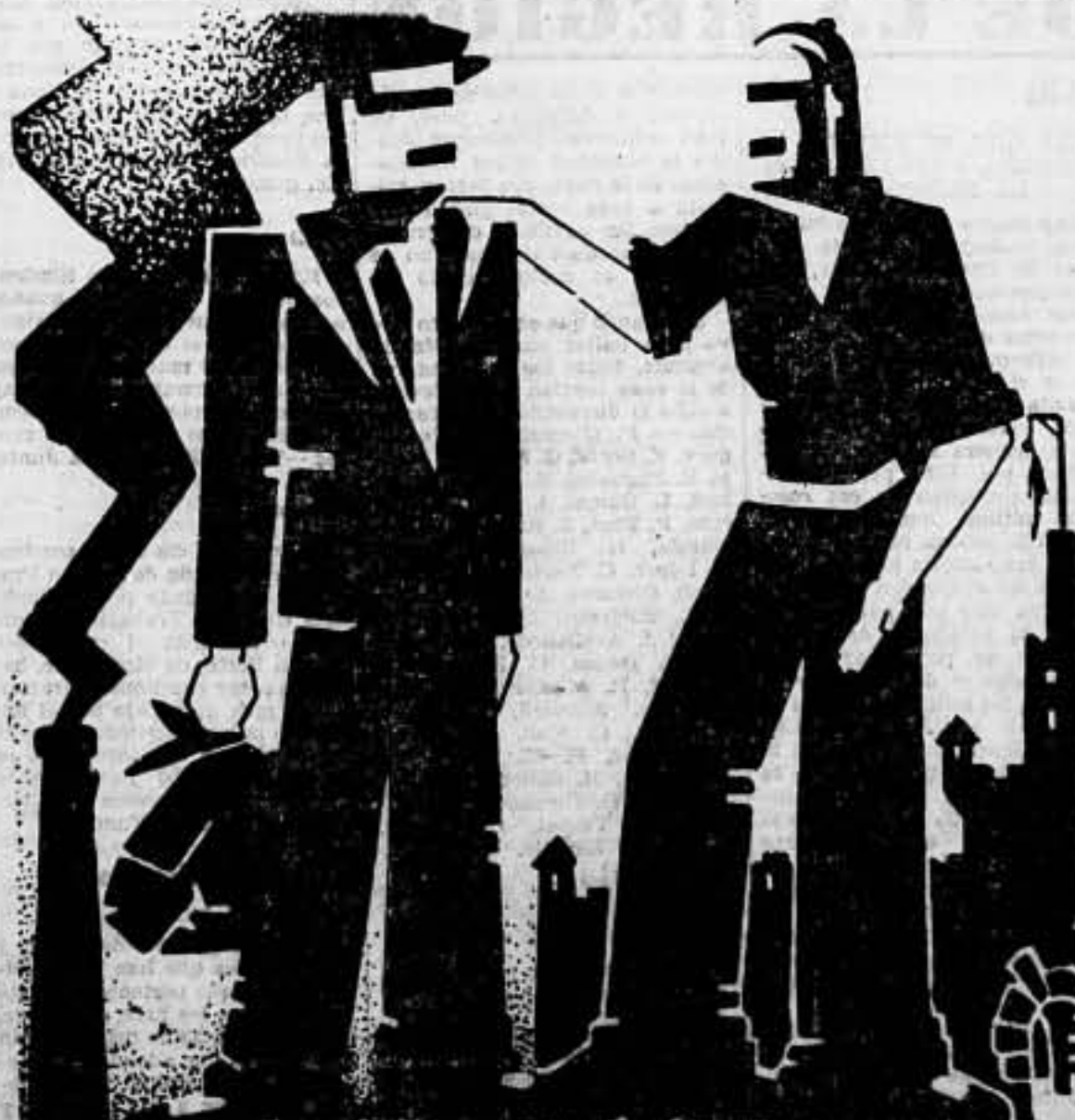
—¿En libertad? —Sí, pero provisional. —¿Es que no lo estamos todos en libertad provisional?