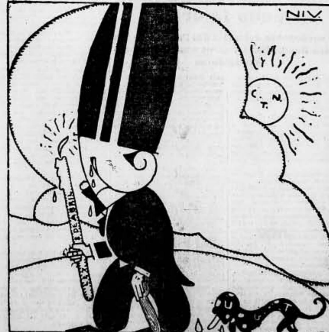
— Con el calor que hace... para poco tiempo me queda vela.