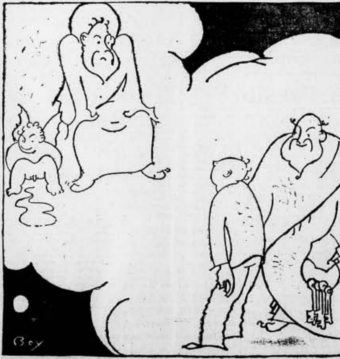
El difunto. — ¡Solo tenía el vicio de votar. EL. — Que te manden al Límbos.