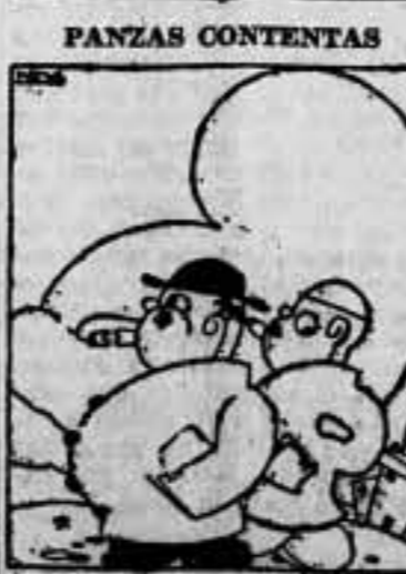
¡Que te parta un "Radium"!

entrevistas por separado y de conjunto. En virtud de estas gestiones han sido sometidas a los contra maestres diversas fórmulas de arreglo que no han sido aceptadas por la representación obrera, porque a su entender no responden a las aspiraciones que originaron el actual conflicto. Ante esta actitud, el delegado de la Generalidad propone para el estudio de las partes afectadas, las conclusiones siguientes: 1.º Establecimiento de un seguro de invalidez y vejez, que beneficie a todos los obreros semanales de la industria fabril y textil, portenescan o no a "El Radium". 2.º Este seguro empezará a regir a los diez años de su aprobación. 3.º Para percibir los beneficios del seguro, los contra maestres pagarán una cuota de una peseta cincuenta céntimos por semana, y los patronos el resto para cubrir los gastos del seguro. 4.º Los obreros a quienes por su edad no les alcance el seguro cobrarán primas equivalentes a las cuotas pagadas según