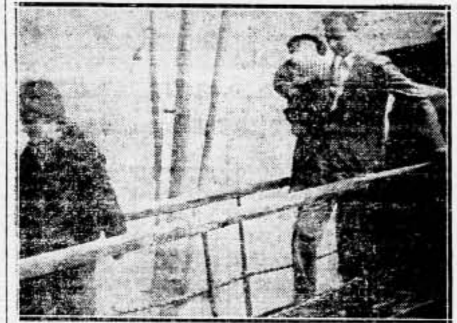
Llegada del coronel Lindbergh, su esposa e hijo al puerto de Liverpool