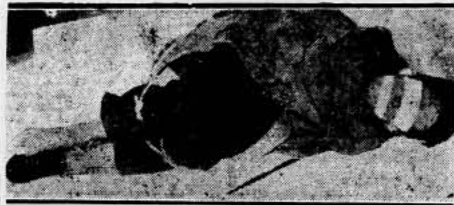
Estado en que fué encontrado el cadáver del joven americano Caleb Milne, de 24 años, objeto de rapto