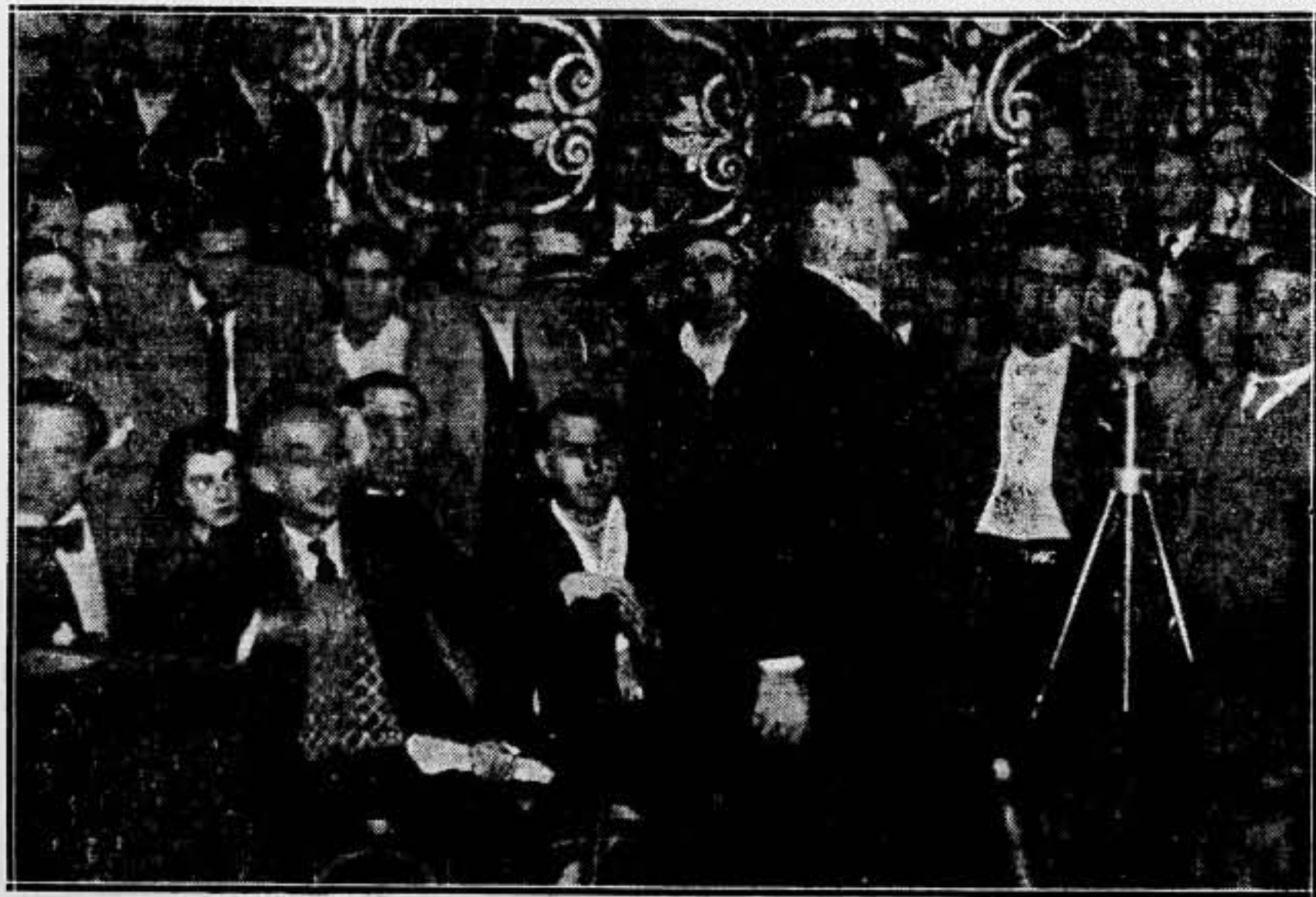
El compañero Durruti pronunciando su discurso ante el micrófono

Vosotros queréis que se os digan las cosas que han ocurrido en España durante todo el período que hemos permanecido amortiguados. Pero no podemos. No se nos deja... porque no hay libertad.