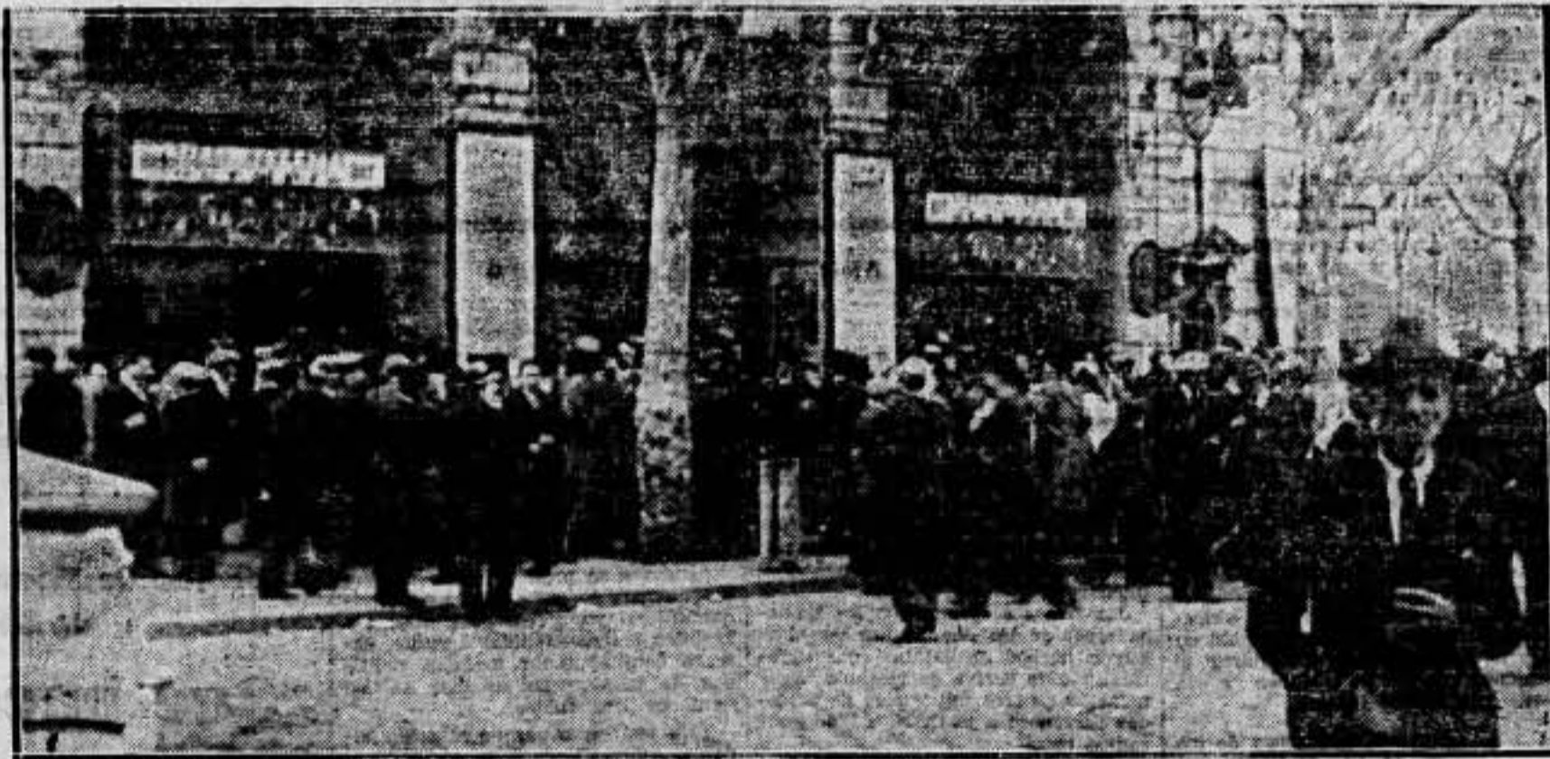
Desfile de la multitud ante la imposibilidad material de poder penetrar al interior

No queremos que nadie nos gobierne. Tenemos derecho a gobernarnos y a dirigirnos nosotros mismos, porque somos los que trabajamos y todo lo producimos. Se nos amenaza con el Código Penal. Yo no entiendo de leyes, ni quiero entender. Pero ellos tampoco entienden de estas cosas. Cuando yo he sido conducido ante un juez, para que éste supiera calificar el delito que había cometido, tenía necesidad de consultar el Código, porque tampoco los jueces entienden de leyes. En cambio yo, para golpear el hierro con el martillo, para templar el acero, para construir la pieza de una máquina, no tengo necesidad de consultar ningún manual de mecánico. Nosotros hemos seguido siempre una trayectoria noble y hemos adoptado una actitud digna. Siempre hemos aconsejado a los trabajadores honradamente. Cuando el movimiento del 6 de octubre, la C. N. T. hizo lo que pudo. Los que con los dioses que fuimos traidores de aquel movimiento, mientan a sabiendas. Si los señores que dicen esto hubieran seguido a la C. N. T. cuando ésta se levantó insurreccionalmente contra la reacción, no habrían tenido ocasión de realizar un 6 de octubre. Tengamos confianza en nosotros mismos, trabajadores y compañeros. Pensamos en que han fracasado todos los partidos políticos y todos los regimenes gubernamentales. Todos ellos se han hundido. Pero la C. N. T. está aquí de pie. Si se nos hunde, no habríamos organizado es-