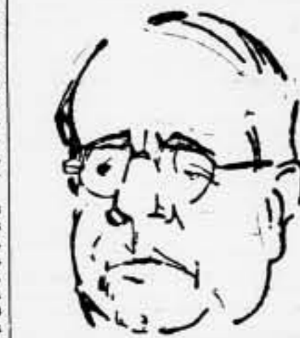
Uno de los firmantes del manifiesto de la coalición "obrerista", que ha causado enorme decepción en el pueblo