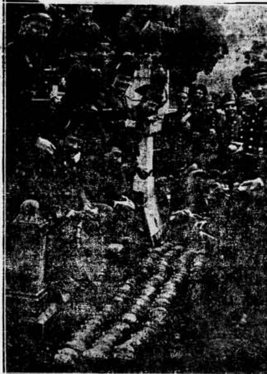
Fuerzas de la Guardia civil y de Asalto custodiando un arsenal de bombas hechas prisioneras

Mucho se ha hablado de Asturias hasta ahora. Pero los que lo han hecho eran aquellos que podían hacerlo "oficialmente"; eran aquellos que, queriendo ocultar los crímenes por ellos cometidos, querían desprestigiar aquel hecho grandioso. Los que hasta ahora han hablado son aquellos que con sus crímenes, egoísmos e injusticias han fomentado aquel levantamiento, aquella unánime protesta del pueblo oprimido y vejado durante tantos años y que señala para el futuro la senda a seguir.