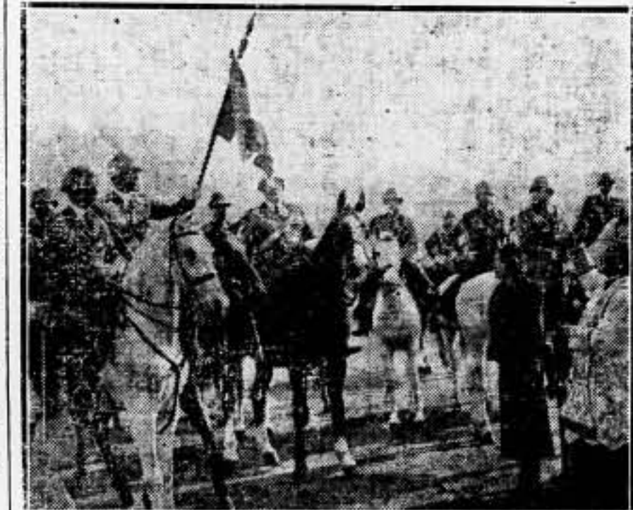
Entrega, por la princesa María de Saboya, de un estandarte al 13.º Regimiento de Artillería, presto a partir para Africa. En primer plano vemos al representante de la religión cristiana bendecir el trofeo de la guerra