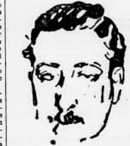
Este señor, sin duda ha creído que el manifiesto de las izquierdas era demasiado reaccionario, y ha retirado su firma del documento