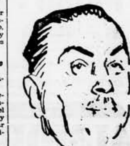
Otro firmante. El antiguo maestro racionalista de Utrera, promete en el manifiesto revisar, no suprimir, la ley de Vagos, la ley de Orden público y la de Jurados mixtos. X nada más.