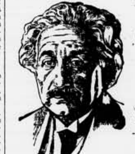
El autor de la teoría de la relatividad será elegido ciudadano de los Estados Unidos en 1938.