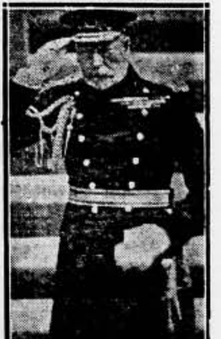
El rey Jorge de Inglaterra, recién fallecido en Sandringham