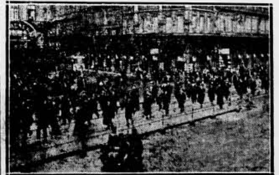
Desfile de los "Cruces de Fuego", en Bruselas

Esto no son invenciones de la fantasía. Centenares de procesados podrán testimoniarlo, y además, se denunció oportunamente, en un documento de los presos de la cárcel de Oviedo elevado a las autoridades, que constituye una acusación impresionante y vigorosa contra los martirizadores y contra el régimen a cuyo amparo pueden cometerse semejantes crímenes.