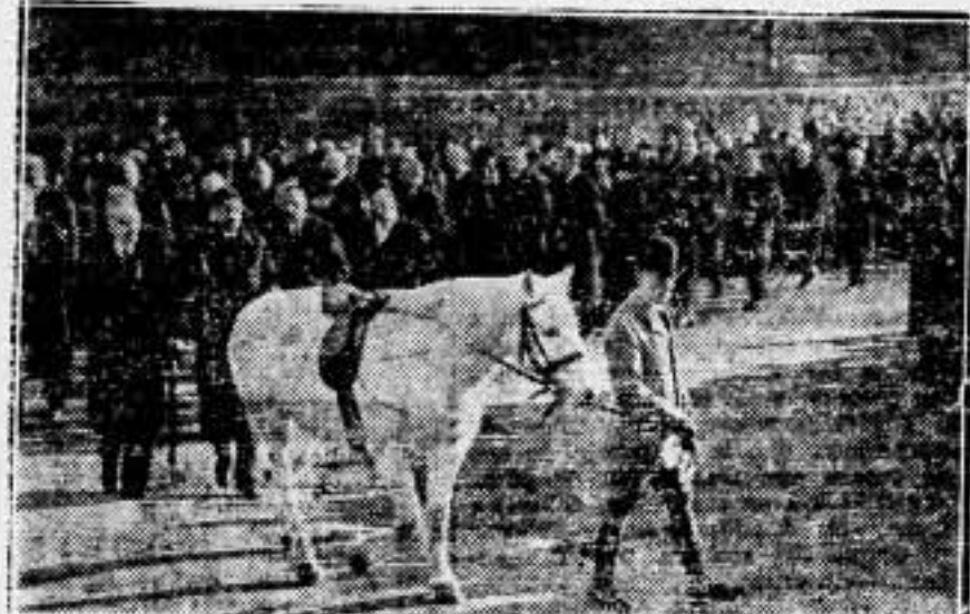
El caballo blanco del difunto rey siguiendo al armón de cañón durante el viaje de Sandringham a la estación de Wolferton