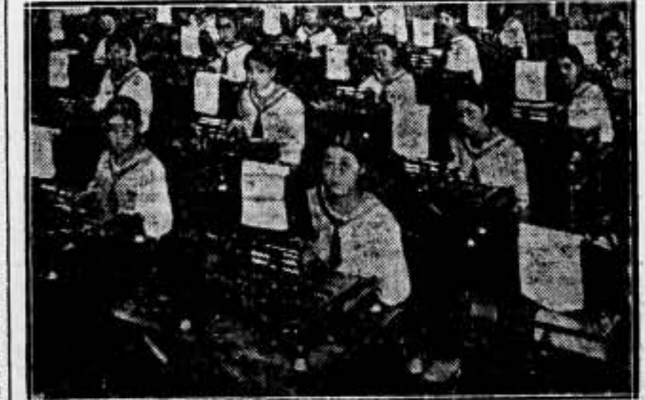
Son bastante complicadas estas máquinas de escribir japonesas. Casi cada palabra tiene su señal especial. Estas muchachas aprenden el oficio de contabilidad y dactilo en la Escuela Comercial de las Hermanas Misioneras en Fukuoka (Japón).