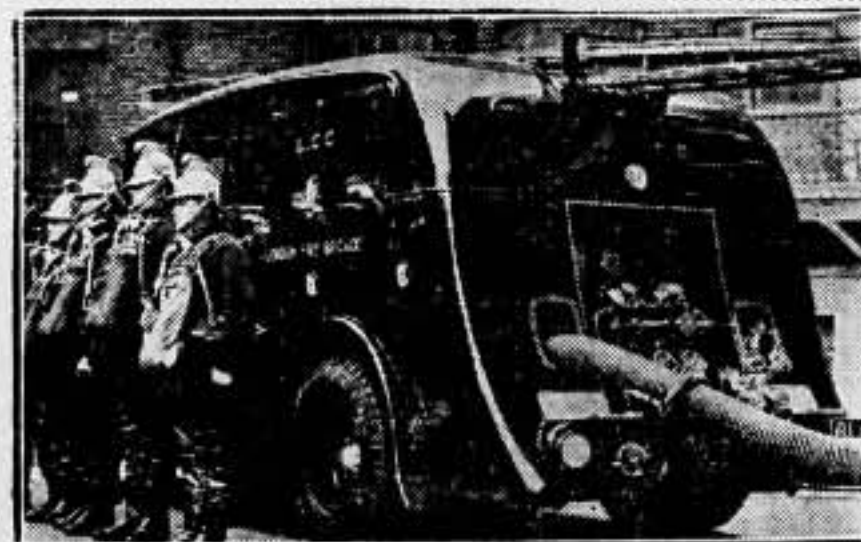
La brigada de bomberos de Londres causará sensación con su nueva máquina aerodinámica de extinción, que les ha sido entregada en Guildford. La nueva máquina aerodinámica al llegar al cuartel general de Southwark, y su equipo de bomberos con sus máscaras contra el humo

Se pone a consideración de los delegados el punto que dice: