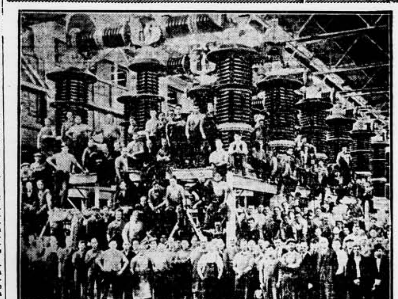
En Filadelfia se están construyendo transformadores de dimensiones enormes, que servirán para la conducción de la corriente eléctrica del nuevo Boulder-Dam hasta Los Angeles

Aunque haya ensayado otras medicinas, le aconsejamos que pruebe el ESTOMACAL BOLGA, pues es el que mejor resultado ha venido dandi en estos casos.