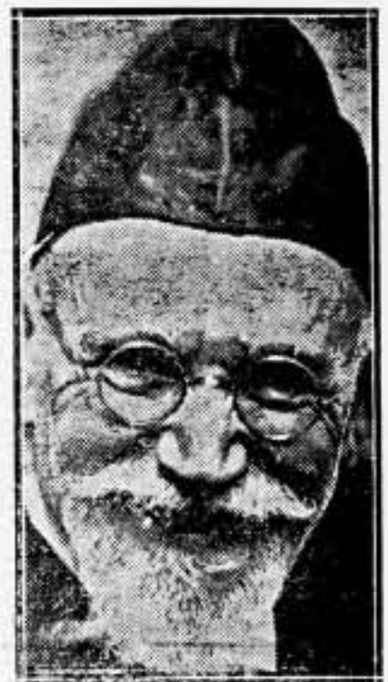
Venizelos, matador moral de Condilys, al arrollar en las elecciones al restaurador de la Monarquía

Como se daba por descontada la presencia en el nuevo Gabinete de algún miembro del partido monárquico afecto al general Condilys, se cree que el súbito fallecimiento de éste pueda provocar un pequeño retraso en la solución de la crisis.