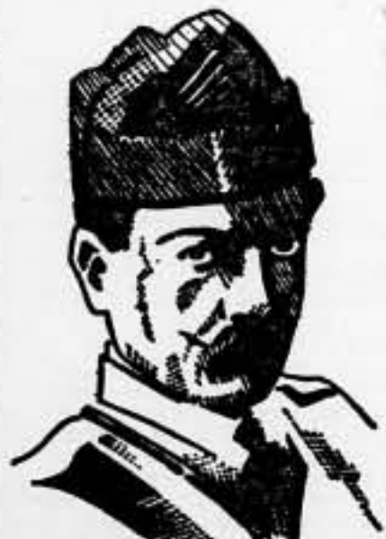
El general Condilys, muerto a causa del trabajo electoral de los venizelistas

En los círculos informativos se reconoce que el nombre del general Condilys pasará a la Historia por su actuación durante el movimiento republicano venizelista y por su acción desarrollada después, encaminada a restaurar la Monarquía, lo que pudo conseguir sin grandes dificultades.