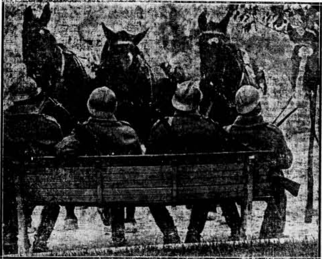
Como se temian desórdenes durante las elecciones, la policía militar estaba preparada, pero no tuvieron motivo para intervenir. Soldados de caballería listos para cualquier emergencia en un parque de Atenas