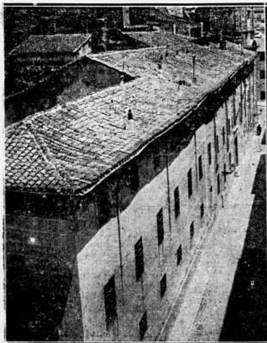
Las Cárcel de Mujeres, de Madrid, que va a ser dedicada a Prisiones Militares