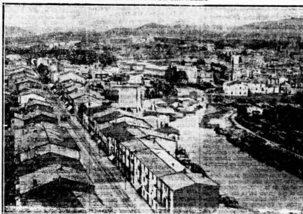
Al fondo, la red montañosa y el río Llobregat, que atraviesa el pueblo