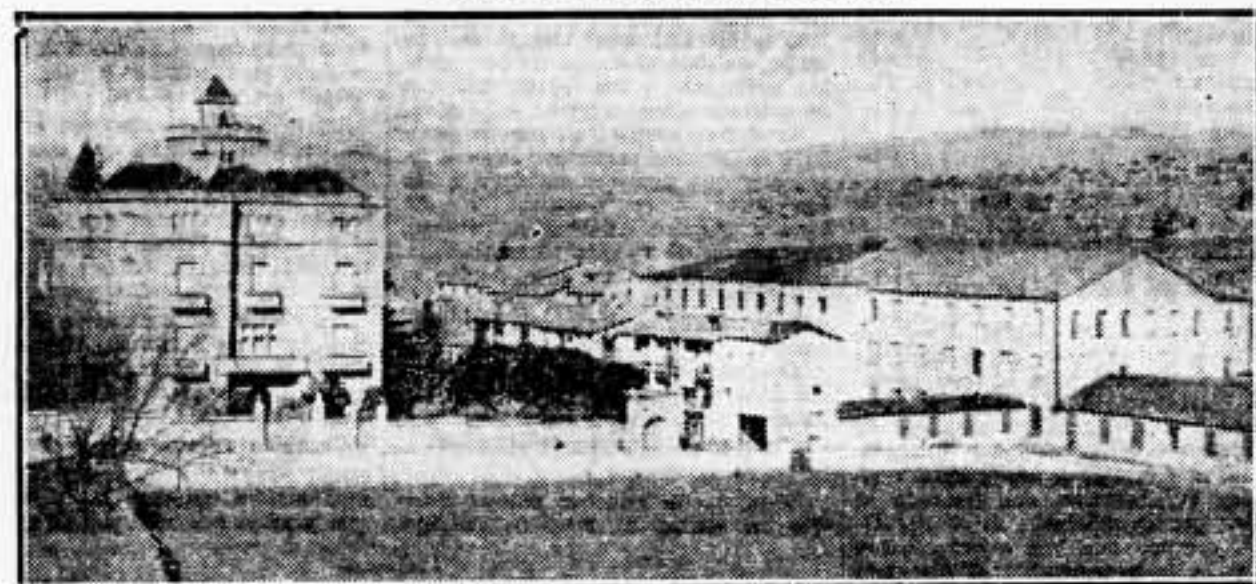
'Can Bassachy', en pleno campo y a poca distancia de Gironella