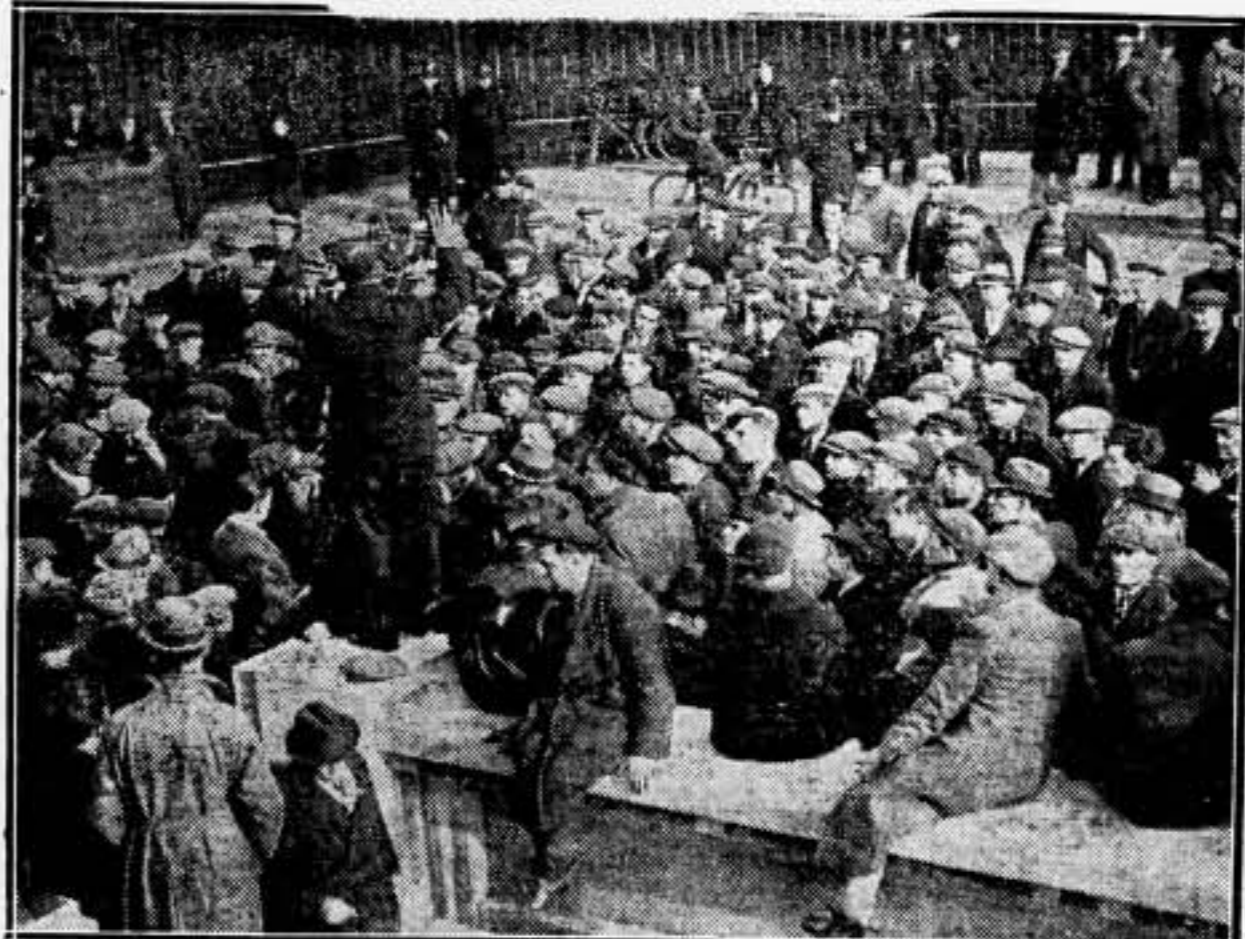
Impedida la entrada de los huelguistas a los Docks por la Policía, celebran un mitin en una calle cercana