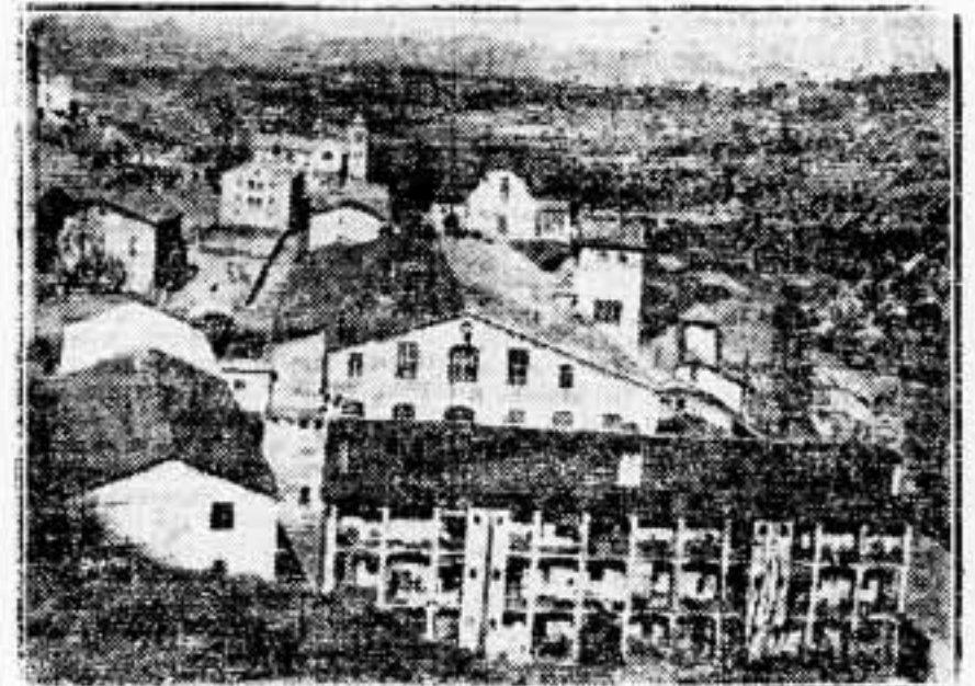
En las márgenes del río, fábricas. He aquí las manufacturas "Viladomiu", donde trabajan infinidad de obreros y obreras

Antes al mismo, por término medio, 102 niñas, y niñas, 130.