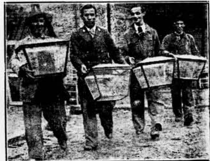
Si estas urnas pudieran hablar después del escrutinio, nos contarían cuántos han votado tres y cuatro veces y los chanchulleros de los interventores