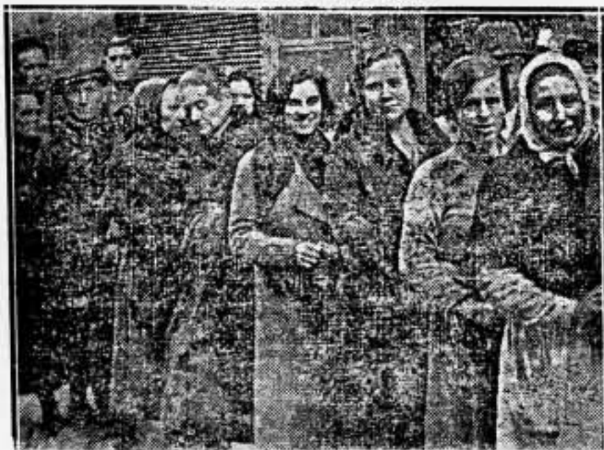
Un barrio obrero de la ciudad. Casas largas, interminables. Mujeres del pueblo. El "pueblo soberano" vota.

Comité de Relaciones Anarquistas de Gatañúa