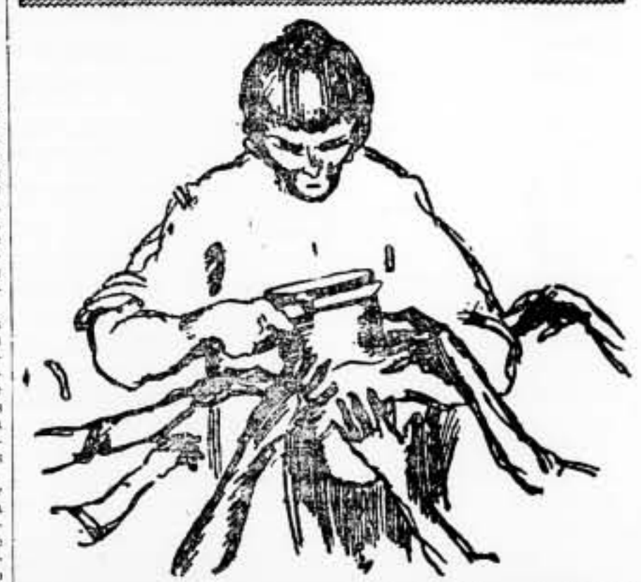
¡Pau! Problema vivo de España, que sólo el proletariado resolverá socializando la economía y aboliendo el Estado