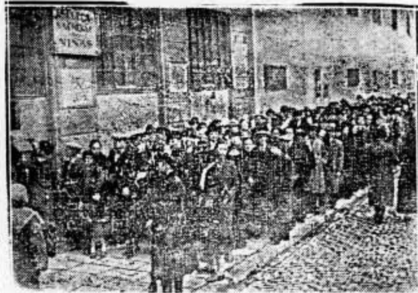
Otra cola, que ocupa casi una manzana. Aquí se ve gente de todas categorías. También votan. La "ciudadanía marcha".