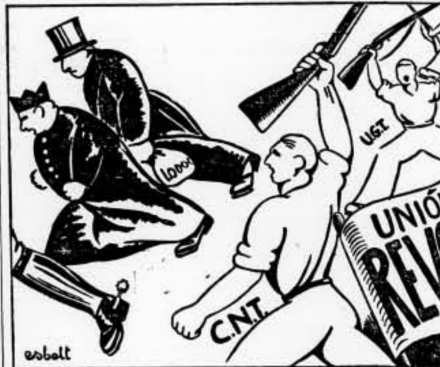
A las alimañas se las apista con el empuje revolucionario del proletariado