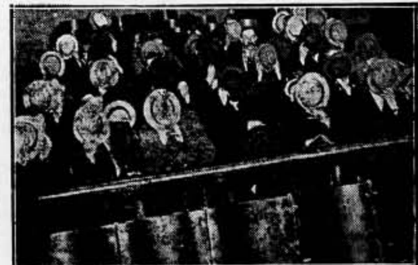
Docecentos hombres pasan ante el Tribunal de Nueva York para ser juzgados por haber sido sorprendidos contemplando a cuatro jóvenes mujeres desnudas. Cuando el desandismo sea interpretado como una norma natural, este aspecto morboso desaparecerá de los humanos