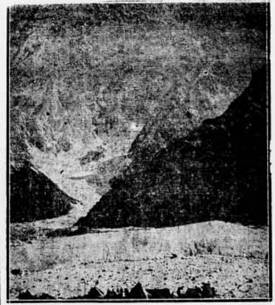
Vista del monte Everest, que una expedición francesa intentará escalar próximamente

mentos vejatorios ni las prohibiciones estúpidas. Las familias y los amigos deberán ser recibidos en el interior y habrán de desaparecer esas odiosas visitas a través de las dobles rejas. Deben habilitarse lugares y locales adecuados, sin características de penal. Para instalar a los condenados políticosociales, laboremus hasta conseguirlo."