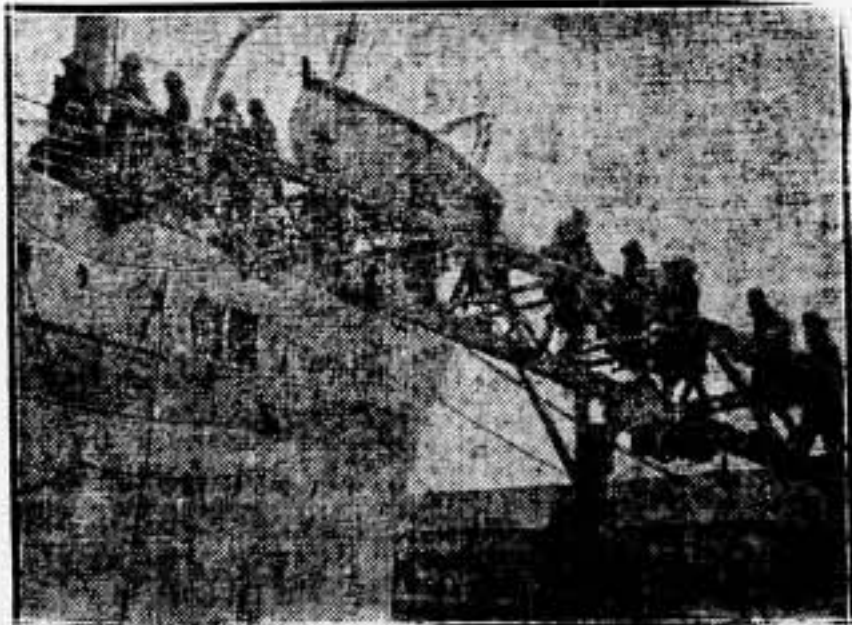
Soldados ingleses embarcando en el buque transporte "Noural", para el Extremo Oriente

Reingreso inmediato y urgente de los seleccionados y discusión serena de las bases que originaron los conflictos; he aquí las vías de solución que nosotros señalamos, y que deben ser tenidas en cuenta.