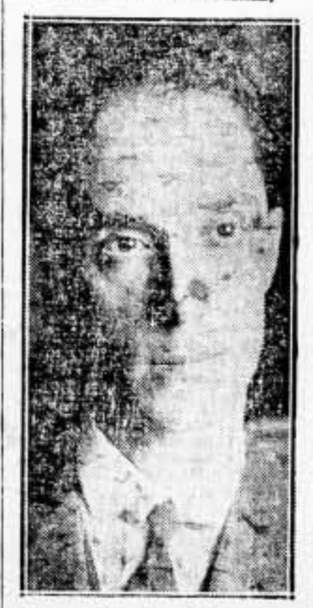
Nuevo gobernador civil de Madrid