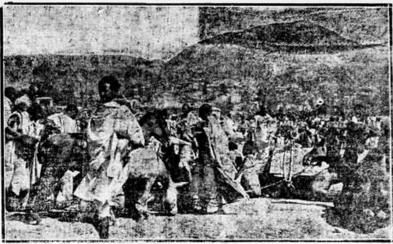
Día de mercado en Malicallé, centro de reñidos combates entre italianos y abisinios