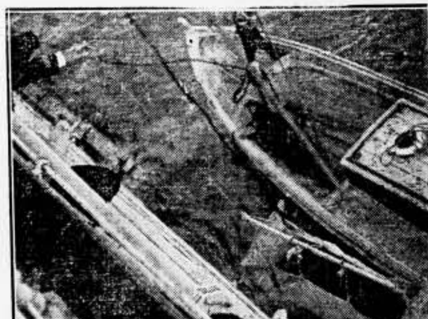
Subiendo un italiano gravemente herido a bordo de un buque hospital italiano, mediante una grúa. A veces, cuando la mar está inquieta, esto se hace muy difícil, y necesita mucha atención por parte de la tripulación.