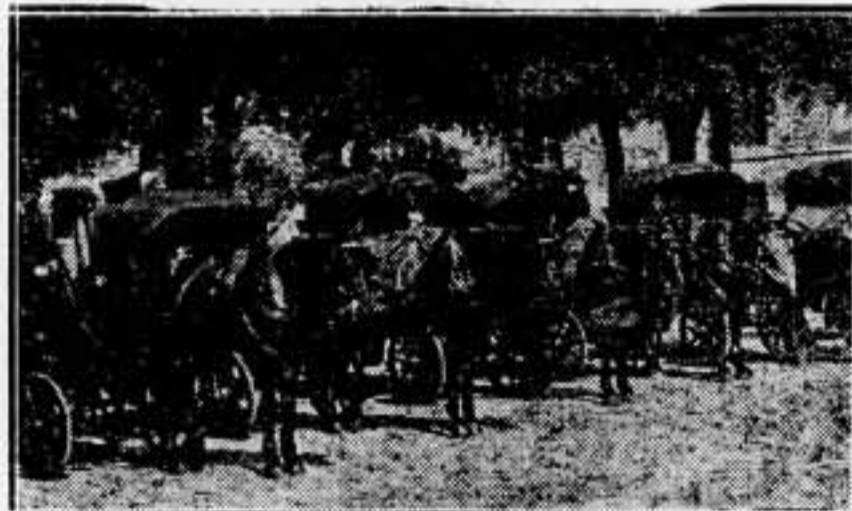
Coches con caballos sustituyen en gran número a los automóviles y taxis.