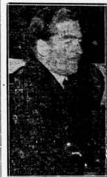
Mr. Eden sale para Ginebra para representar al Reino Unido en la sesión del Comité de los Derechos, que tendrá lugar en aquella capital. El Comité tratará del embargo del petróleo a base de los informes de los expertos. Mr. Eden fotografiado en el tren-lancha, en Victoria, en el momento de salir para Ginebra.