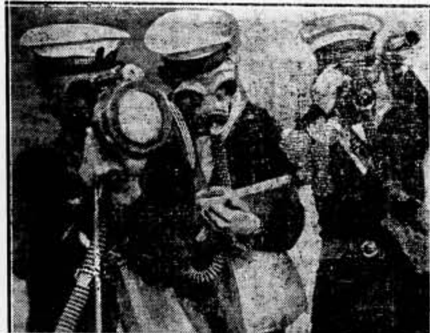
Ataques de gases asfixiantes a Tenerife. — Hombres de señales, durante las maniobras, con caretas de gas.

Pero bueno es hacer constar que nosotros no queremos hacer un balance de las injusticias, que al amparo de esta ley se han cometido. Nosotros pedimos, exigimos, que la ley de Vagos y Maleantes sea derogada por injusta, por negativa y por infame.