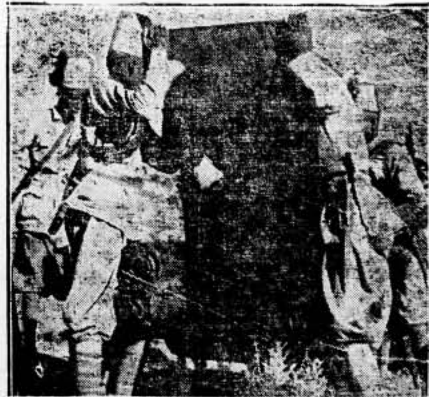
Soldados indígenas italianos, manejando un cañón durante los últimos combates.