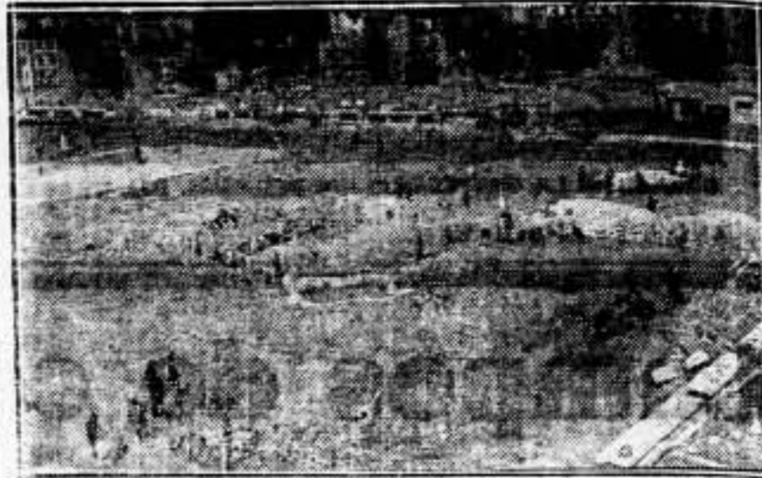
Vista de los jardines de caballerizas de Madrid, donde han empezado a trabajar varias cuadrillas de jardineros para terminarlos cuanto antes.

(Sección Calefacción) Por acuerdo de los Comités de las casas, avalado por la Técnica de la Sección, el horario que regirá desde el día 9 del corriente, será el de ocho horas diarias excepto el sábado, que será de cuatro horas por la mañana. Para más detalles, pasarse por el local social, Mercadera, 26. La Comisión Técnica