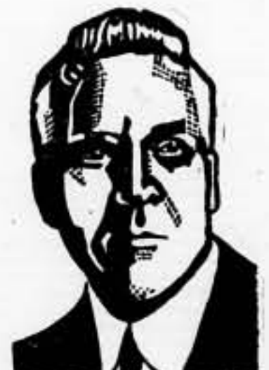
Alfred Rosenberg, teórico del "socialismo"

Los trabajadores no podemos detenernos en buscar a los responsables de esta gravísima situación, ya que todas las naciones tienen por igual una parte de culpa. Hemos, sin embargo, de estar alerta, porque la guerra va contra el proletariado, contra todo principio de libertad y de justicia, y más que nada para detener el avance de la revolución social.