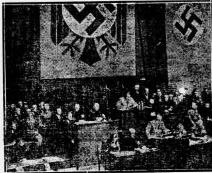
Primer telefoto del discurso de Hitler, en el Reichstag