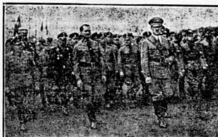
El «Führer» llegando a la plaza con los jefes políticos.

REUNION DE LOS JEFES POLITICOS EN LA PLAZA «ZEPPELNWIESE»