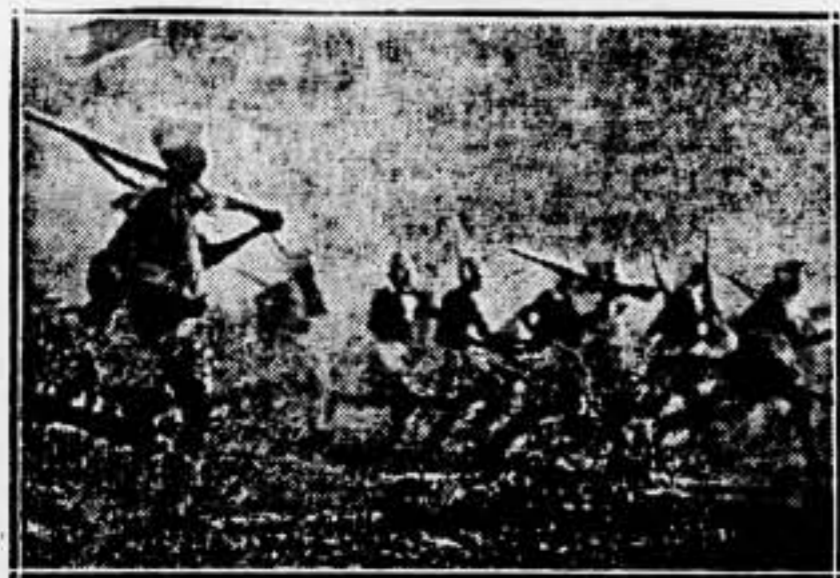
Infantería indígena italiana, dando una carga, durante el ataque a Amba Alagi, plaza fuerte de los abisinios, que fué llamada la "puerta para Adís Abeba".

He aquí el panorama que nos ofrece Europa en estos momentos gravísimos para la clase trabajadora, única que sufre las consecuencias de la locura bárbara del capitalismo. En Ginebra no existe solución para la guerra, por el contrario, es allí donde ella se fomenta por los mismos que hipócritamente hablan de paz. La solución está en las organizaciones revolucionarias del proletariado. Iniciemos una intensa campaña antimilitarista, negándonos también a fabricar instrumentos de muerte. Por otro lado, es necesario agitar a la juventud para que ésta no se deje embriagar por esa fiebre estúpida de patriotismo que la llevó a la masacre de 1914. Prograguemos también a la mujer para que no dejen a sus hijos que marchen a los campos de batalla, y por último, orientemos a los trabajadores, preparándoles para que salgan a la calle en huelga general revolucionaria, tan pronto se ordene la movilización del ejército. Este es el único medio de evitar la guerra. La Revolución Social es el único medio de evitar la guerra. La Revolución Social es el único medio de evitar la guerra.