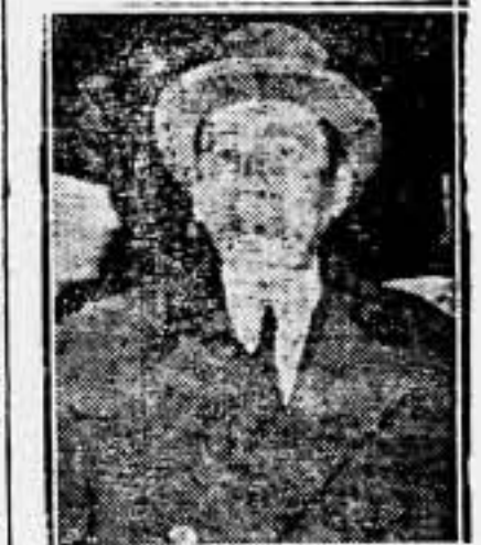
El primer ministro de Rumania, Titulesco, a su llegada a la capital de Inglaterra, para tomar parte en las deliberaciones.