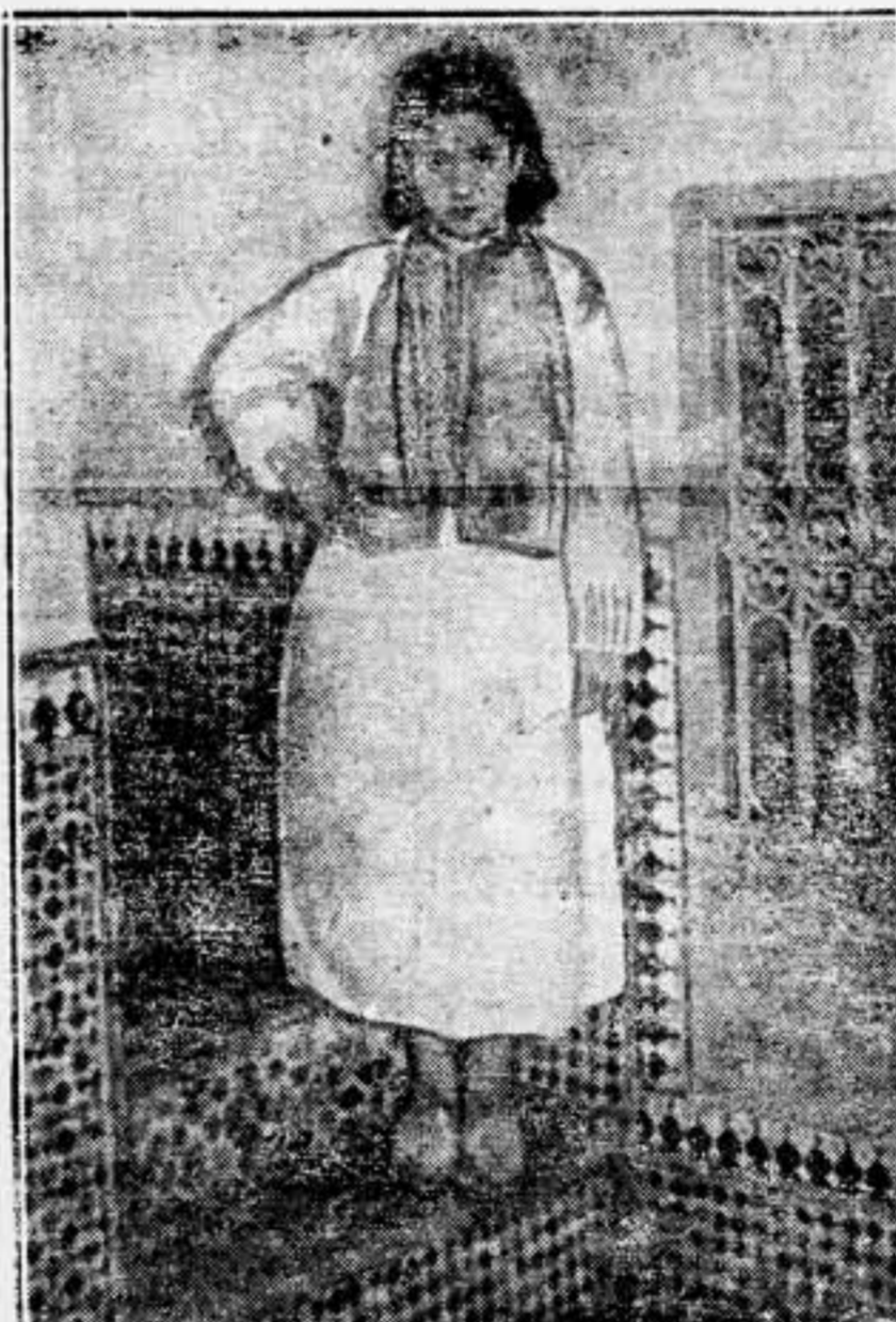
Prostituta mora de quince años. ¿Tolerar esto, es llevar la civilización?

Este número de SOLIDARIDAD OBRERA, ha sido visado por la censura gubernativa