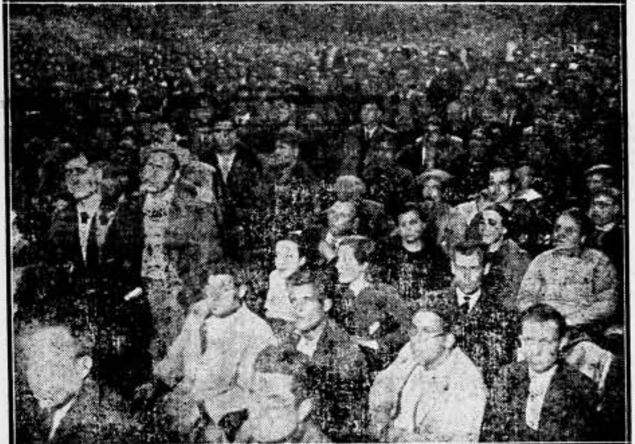
Aspecto parcial del patio de butacas. Obsérvese que incluso el pasillo está repleto de obreros del Transporte.

La asamblea que puso fin al conflicto del Transporte. Muchos millares de Trabajadores llenaron la amplia sala. Un viva clamoroso a la C. N. T., cerró este gran acto de decisiva importancia para los Sindicatos de Cataluña