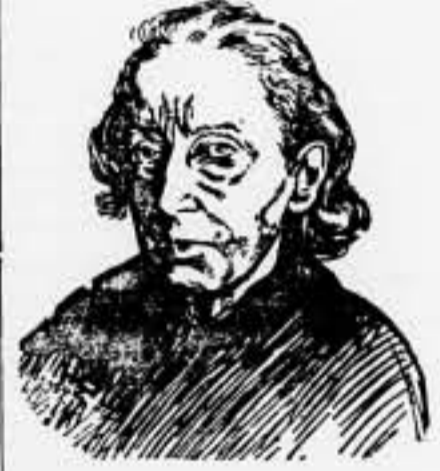
Heroína de la "Commune" de París

después de una resistencia heroica de los bravos revolucionarios. Y vino después la venganza fría, premeditada, de esa fiera.