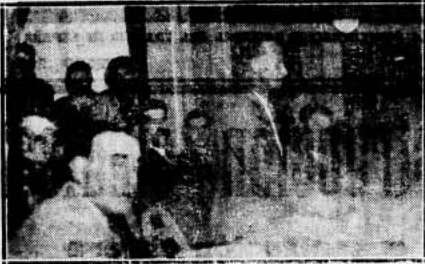
La Presidencia de la Asamblea del Sindicato Único del Transporte.