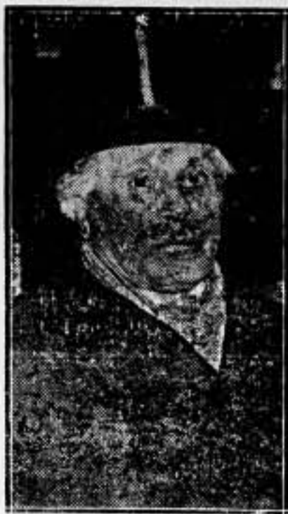
Delegado permanente de Francia a la Liga de Naciones