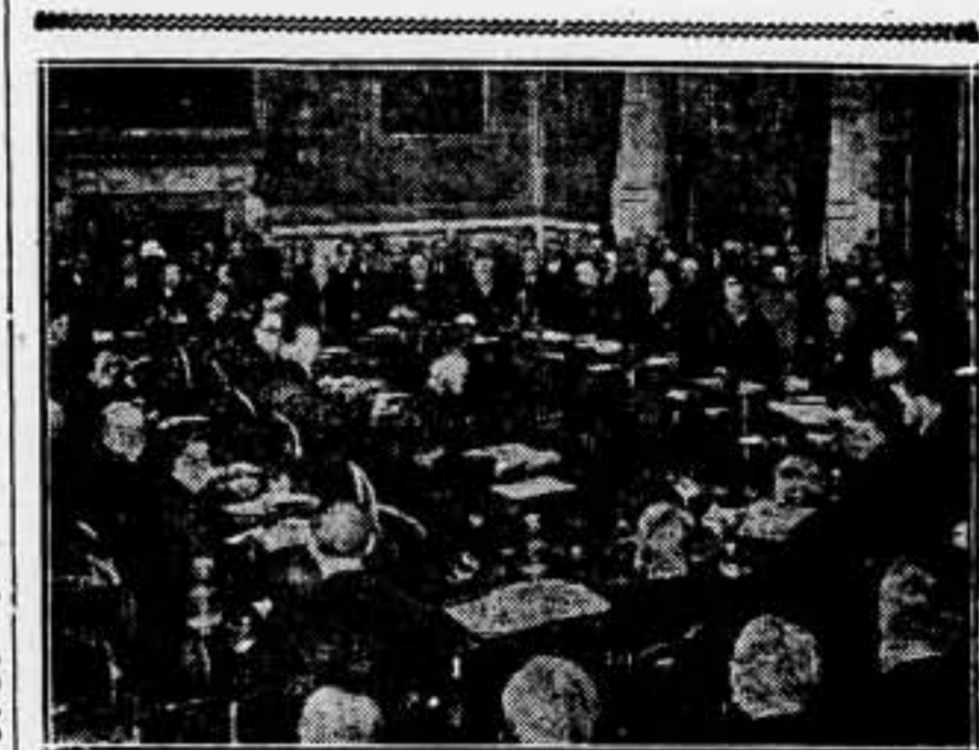
El Consejo de la Liga de las Naciones delibera sobre la situación que ha creado Alemania con la vulneración del Tratado de Locarno.

Nosotros no podemos regocijarnos con los que celebran alborozadamente la liberación de los presos; porque sabemos, que multitud de hombres, que fueron condenados por sus ideas o su intervención político-social, quedan aún en presidio y exigen de todos un esfuerzo para librarlos definitivamente de las rejas.