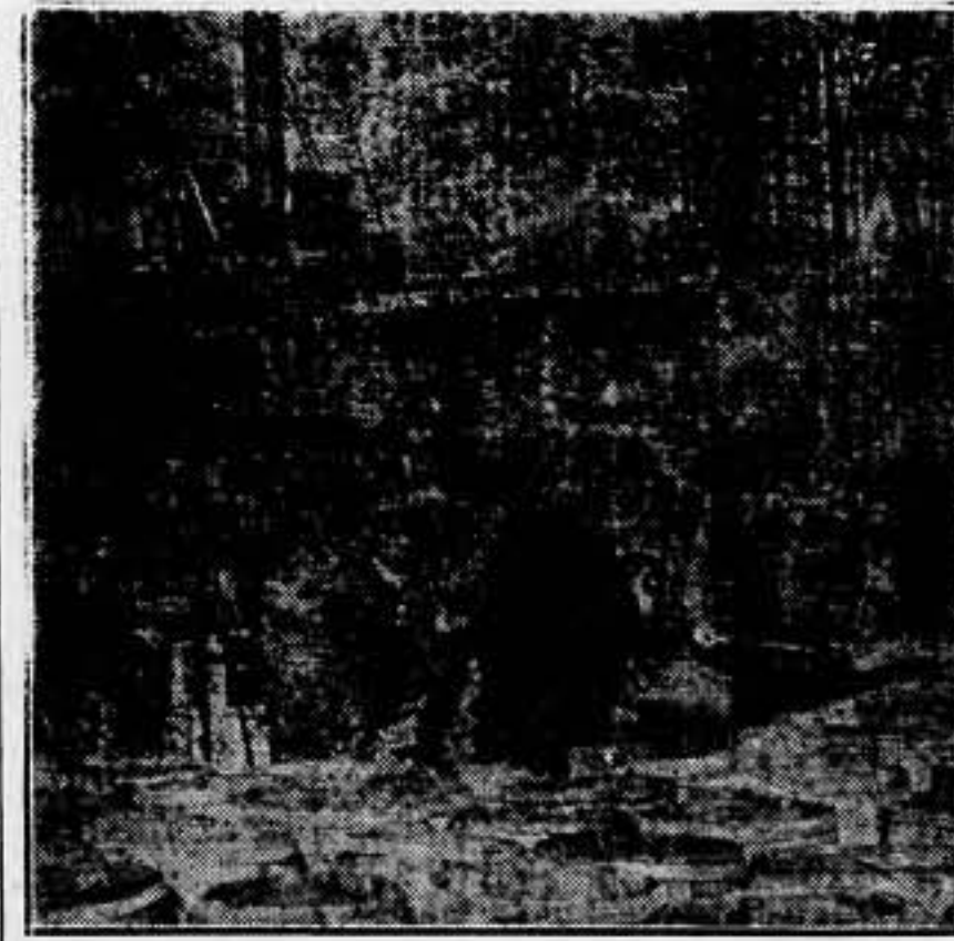
Vista del mercado de pescado en Nueva York, que en ocasión de la cuarentena aumentó sus ventas en un treinta por ciento.