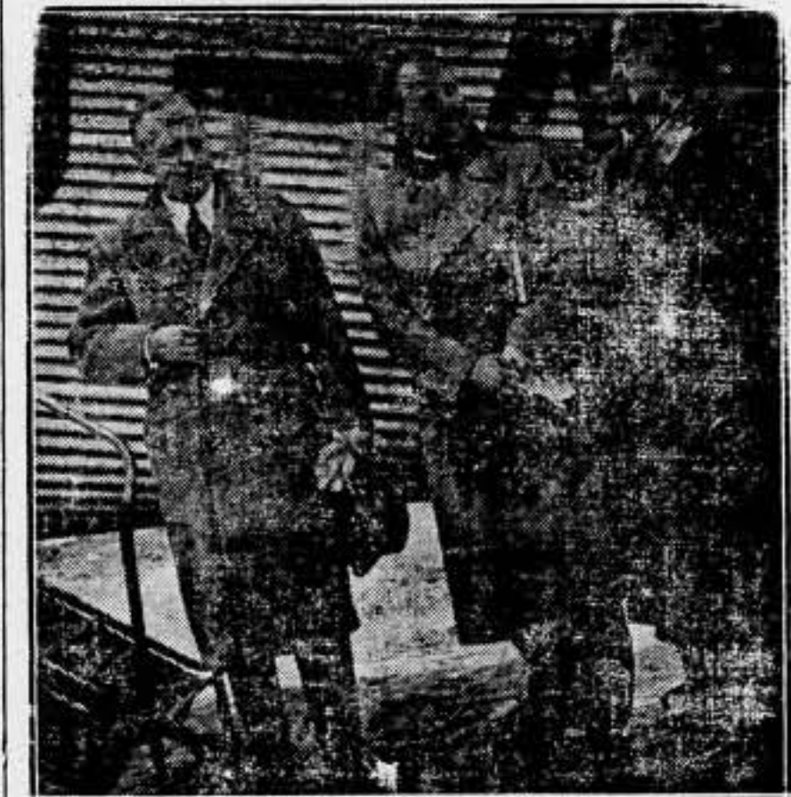
La salida en avión del embajador von Ribbentrop a Londres, con los demás miembros de la delegación alemana que representan al Reich en el Consejo de la Liga de Naciones.