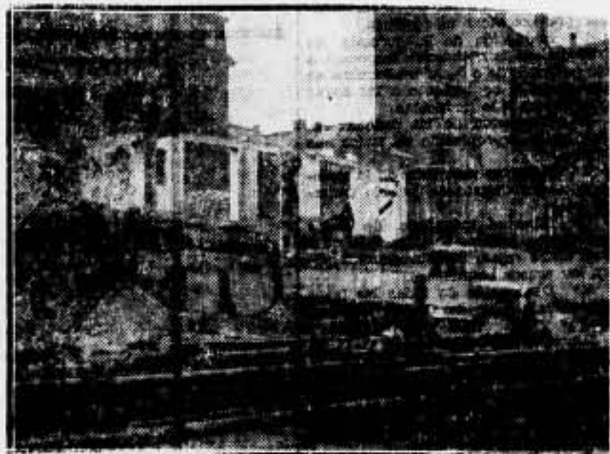
Demolición de los barrios bajos de Gaengenviertel (Hamburgo). Derribo de un barrio.