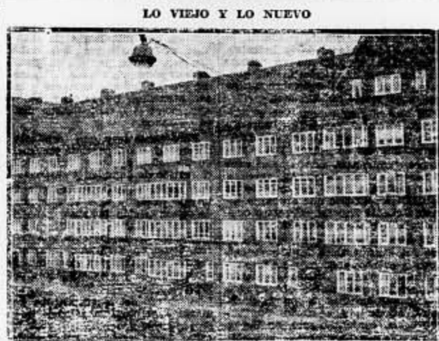
Una de las nuevas casas que se han levantado en los barrios bajos de Bilbao. Aunque tiene un aspecto de uniformidad carcelaria, aventaja a las antiguas chozas miserables que había en su lugar.

La Constitución moderna es la norma de gobierno por la que se rige cada Estado; mas el Estado suele decir que en su Constitución respeta y sostiene equitativamente las relaciones individuales y sociales en su función, que aunque no se contradice con lo anterior, es conveniente poner de manifiesto que las relaciones se mantienen con equanimidad cuando no se perjudica en sus derechos a cada individuo. Ayer la Constitución era consuetudinaria y tenía la facilidad (no se vaya a creer que me acomodo a la caprichosa visión de un rey o de sus consejeros, pues aborrezco a todos los tiranos: sin determinar inmiscuirme, porque el caso no lo requiere, en su conciencia o en su inconsciencia, me refiero al pueblo en general) de adaptarse a la evolución de las costumbres; hoy la Constitución es escrita y posee el defecto de no permitir que se haga justicia, por la visión equivocada de sus legisladores, que también con hom-