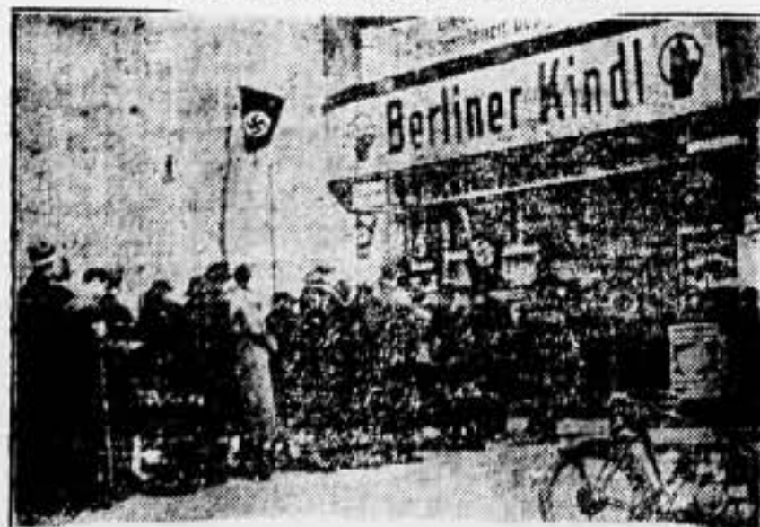
La sala de votantes en un Colegio de la capital alemana.