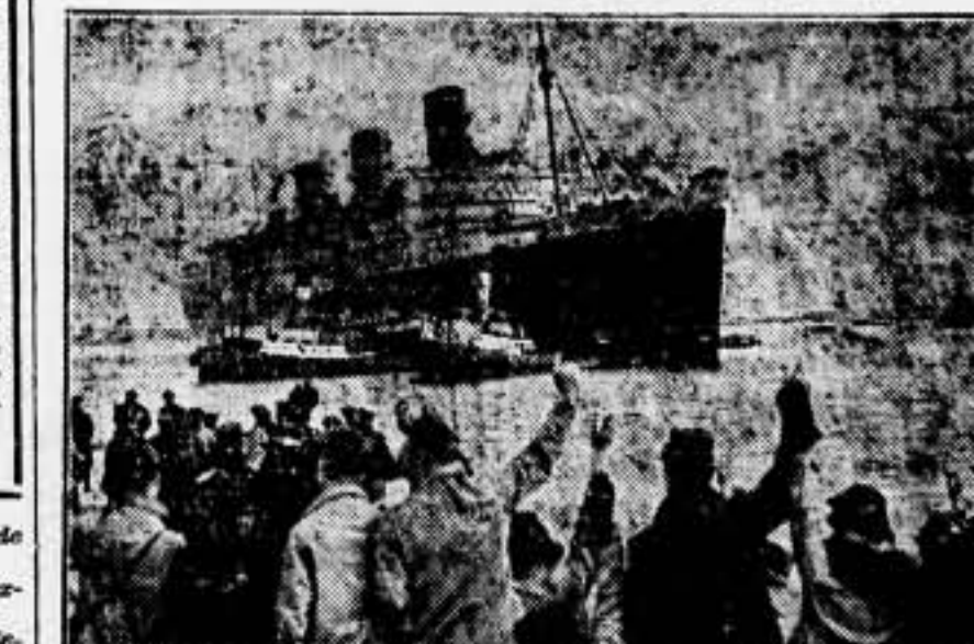
La muchedumbre, en los muelles de la ciudad, evolucionando al "Queen Mary" a su paso al "dock" Jorge V.