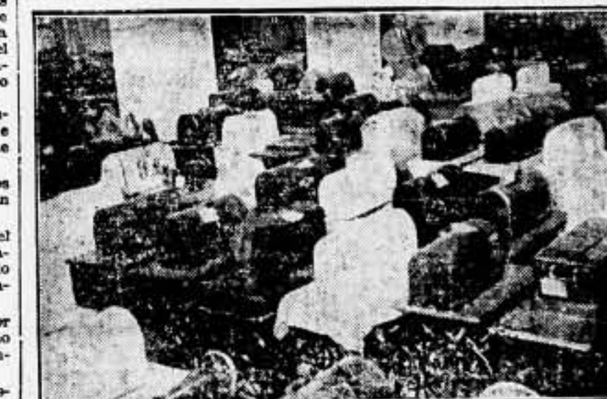
Se gestiona la devolución a sus propietarios de las máquinas de coser pisadoras en el Monte de Piedad de Madrid.

¡Pellagra la libertad... El fascismo amenaza y hay que detener su avance. Este régimen de violencia y de terror solo puede ser vencido por la violencia revolucionaria del proletariado.